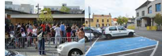
Devant l'école Desnos.

La sécurité aux abords du nouveau groupe scolaire Robert-Desnos fait l'objet de toutes les attentions. Afin de limiter les risques liés à la circulation, dense aux heures d'entrée et de sortie de l'école, et aux difficultés de stationnement dans la rue Salvador-Allende, la municipalité a mis en place un nouveau passage-piéton et recruté un agent de traversée . D'autres aménagements sont à l'étude avec le référent sûreté de la gendarmerie.