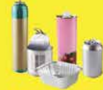
Boîtes métalliques, aérosols, barquettes