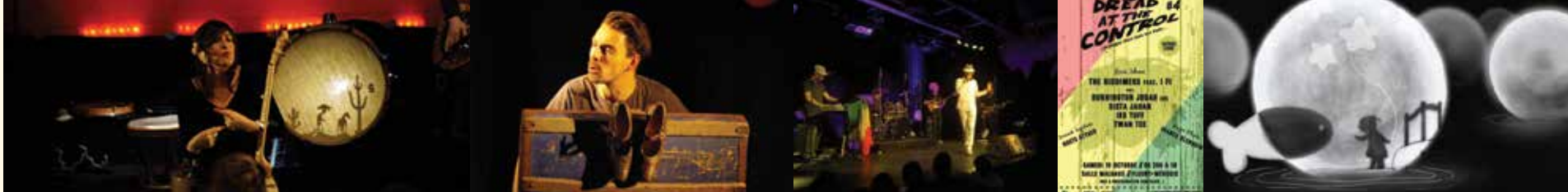
Où es-tu Lune ?