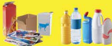
Papiers, emballages et briques en carton