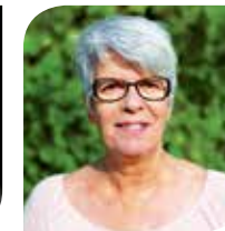
Aline Cabeza , maire-adjointe chargée de l'Action sociale, du Logement et de la Lutte contre les discriminations