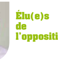
Élu(e)s de l'opposition