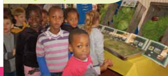
Animation autour des différentes variétés de salades à l'école Langevin le 21 septembre dernier.

* Inpes : Institut national de prévention et d'éducation pour la santé.