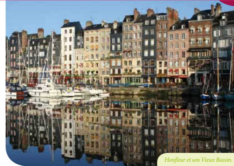
Honfleur et son Vieux Bassin.

Pour tout renseignement, un numéro vert : 0 800 293 991.