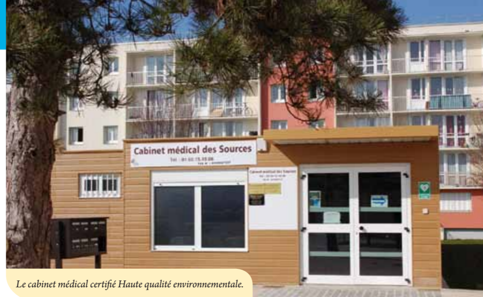
Le cabinet médical certifié Haute qualité environnementale.

Contrairement à certaines idées reçues, le développement durable ne se réduit pas à la protection de l'environnement. Il s'agit d'une démarche globale qui irrigue tous les domaines clés de notre société (environnementaux, sociaux, économiques), lesquels fonctionnent en interdépendance. Comment par exemple réduire l'impact des activités humaines sur l'environnement sans envisager la relocalisation de l'emploi et le développement de transports alternatifs ? Les actions menées par la municipalité sont à l'image de cette transversalité. Les principes du développement durable peuvent être appliqués à différents niveaux : en interne, dans les services de la mairie, à l'extérieur, pour des projets sur la ville. Enfin, ils peuvent être repris par chaque habitant de Fleury. Un chantier immense qui laisse place aux initiatives et crée de nouvelles dynamiques dans tous les secteurs.