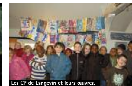
Les CP de Langevin et leurs œuvres.

tiques», les enfants ont eu le privilège d'alterner des sorties au musée en Herbe, une journée au château d'Auvers-sur-Oise et des ateliers d'arts plastique dans les musées et au centre de loisirs de Fleury. Immergés pendant une semaine dans l'univers des couleurs, des styles et des sources d'inspiration des artistes, ils ont vécu une aventure artistique passionnante grâce à cette formule de classe de découverte qui les sort de leur contexte quotidien. Concrètement, les connaissances ont été ré-exploitées à travers la création personnelle d'un livre constitué de sept tableaux abordant les temps forts de ce bain artistique, les couleurs mais aussi les différentes techniques : peinture, encre, craie grasse, collages... Plus globalement, la réalisation de ce livre-tableaux s'inscrit dans un projet