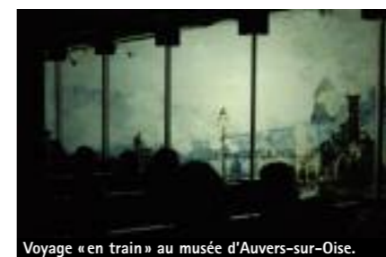
Voyage « en train » au musée d'Auvers-sur-Oise.