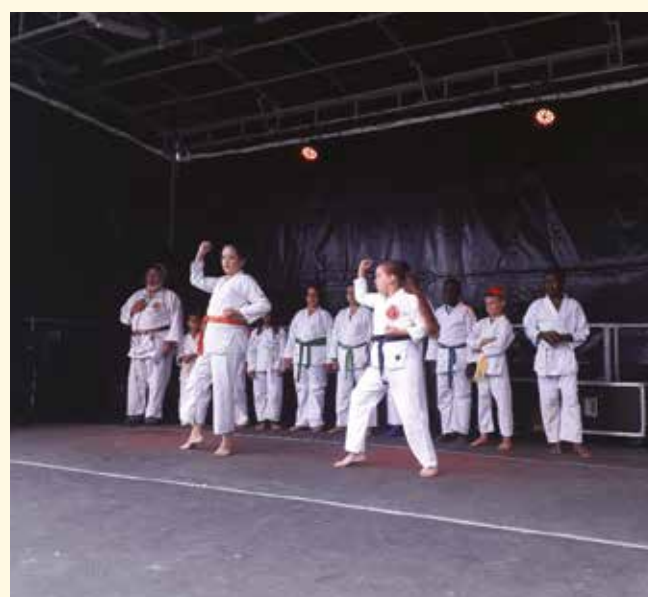
Les élèves de l'école Cocâtre en extérieur en raison du Covid (en haut) et en démonstration lors du forum des associations 2020 (en bas).