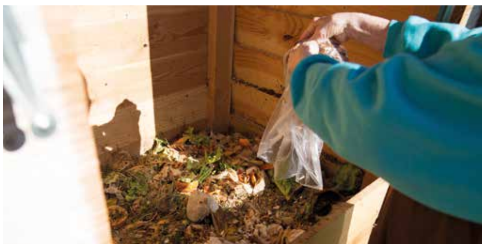
Les déchets de jardin sont particulièrement adaptés au compostage.

collecte au porte-à-porte (voir modalités ci-dessous). Mais on peut aussi opter pour le compostage. De quoi s'agit-il ?