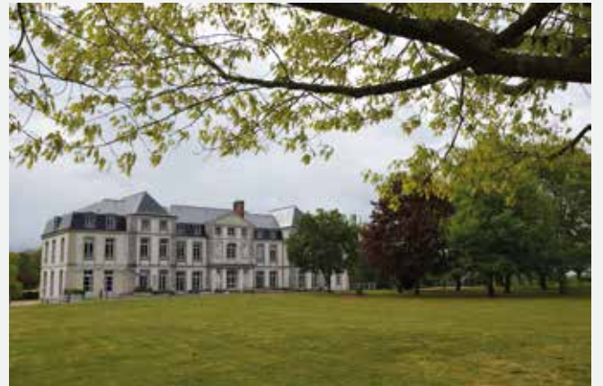
Le château de Fleury aujourd'hui.

chambre bleue, etc. Les propriétaires du domaine, la dynastie des Joly de Fleury (voir l'article ci-dessous), exercent des