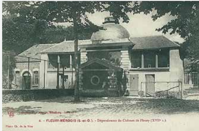
Une dépendance du Château du 17 e .

Construit en 1726 par Louise Bérault, femme de Joseph Omer Joly, l'actuel château est venu remplacer l'ancien corps seigneurial de son ancêtre. Une grande porte vitrée et un vaste perron permettent de pénétrer à l'intérieur. A côté d'un salon, d'une salle à manger et d'une salle de billard, on n'y compte pas moins de vingt-six chambres qui reçoivent toutes un nom: la chambre rouge, la chambre jaune, la