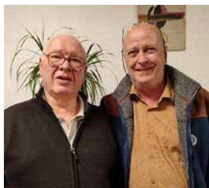
Deux invités de marque pour cette soirée-débat.