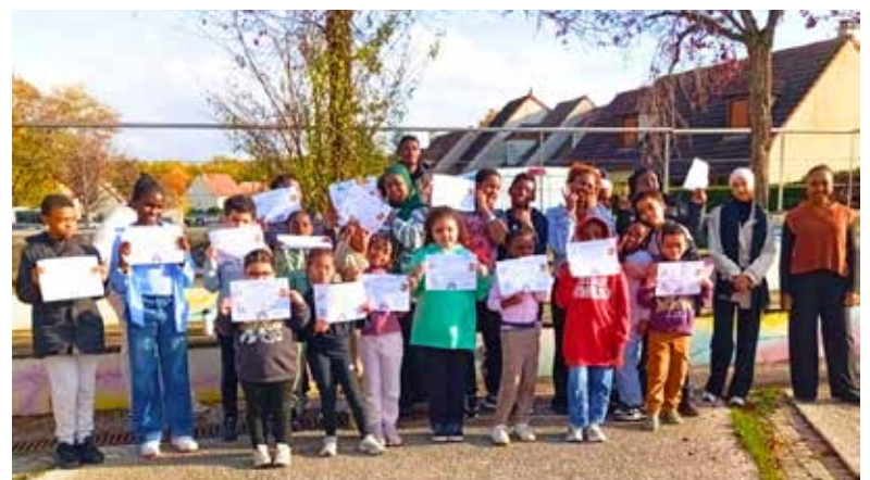
Les animateurs ont remis un diplôme à tous les participants.