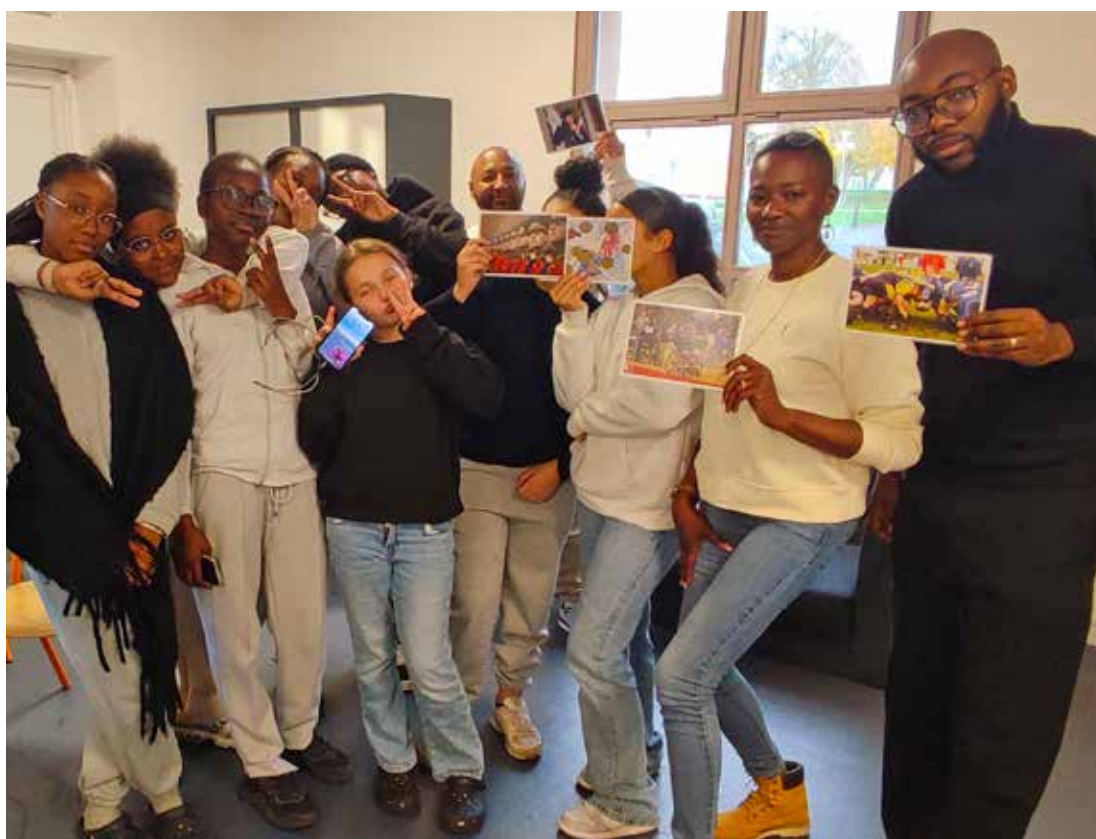
De beaux échanges entre jeunes avant de voir le film qu'ils ont choisi eux-mêmes !

Comme chaque année, novembre est placé sous le signe de la jeunesse. Si les deux derniers événements de ce mois ont permis de mettre en avant des jeunes talents, des parcours prometteurs et autres réussites «made in Fleury-