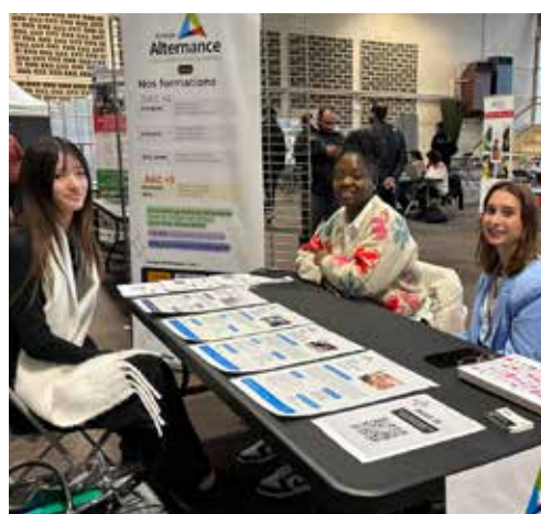
L'alternance offre des opportunités.