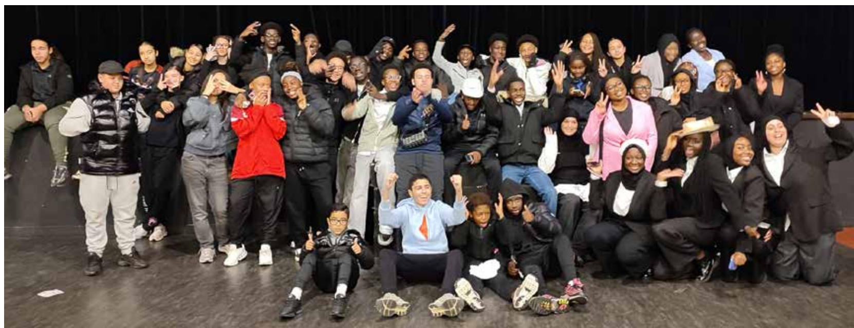
Une jeunesse déterminée : bravo à tous !

À Fleury-Mérogis, les jeunes ont tous un talent fou. Ils nous l'ont prouvé lors de la 3 e édition du Mois de la Jeunesse. La ville a mis à l'honneur des jeunes qui avancent, qui s'engagent et qui construisent leur avenir. Une jeunesse déterminée, qui fait la fierté de la ville. Retour en photos de la journée des jeunes talents du 29 novembre.