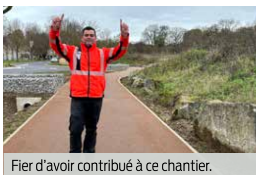
Fier d'avoir contribué à ce chantier.