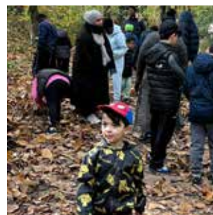
Les enfants adorent ramasser les châtaignes.