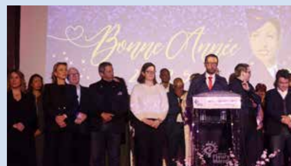
En janvier 2026, rendez-vous le samedi 17 janvier, au gymnase Jacques-Anquetil.

Réception des vœux Samedi 17 janvier 2026 18h au gymnase Jacques-Anquetil Entrée libre