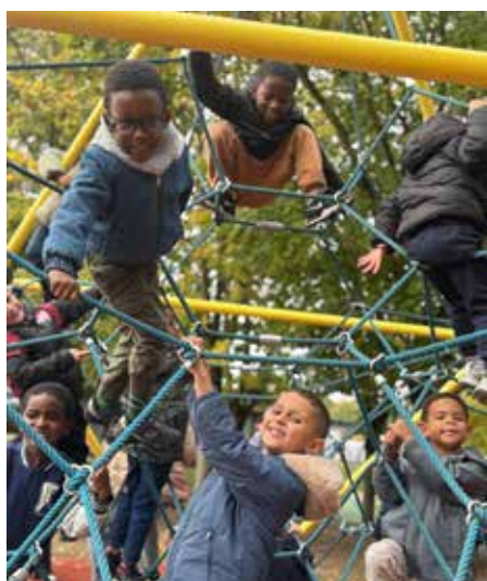
Profiter des structures en plein air.