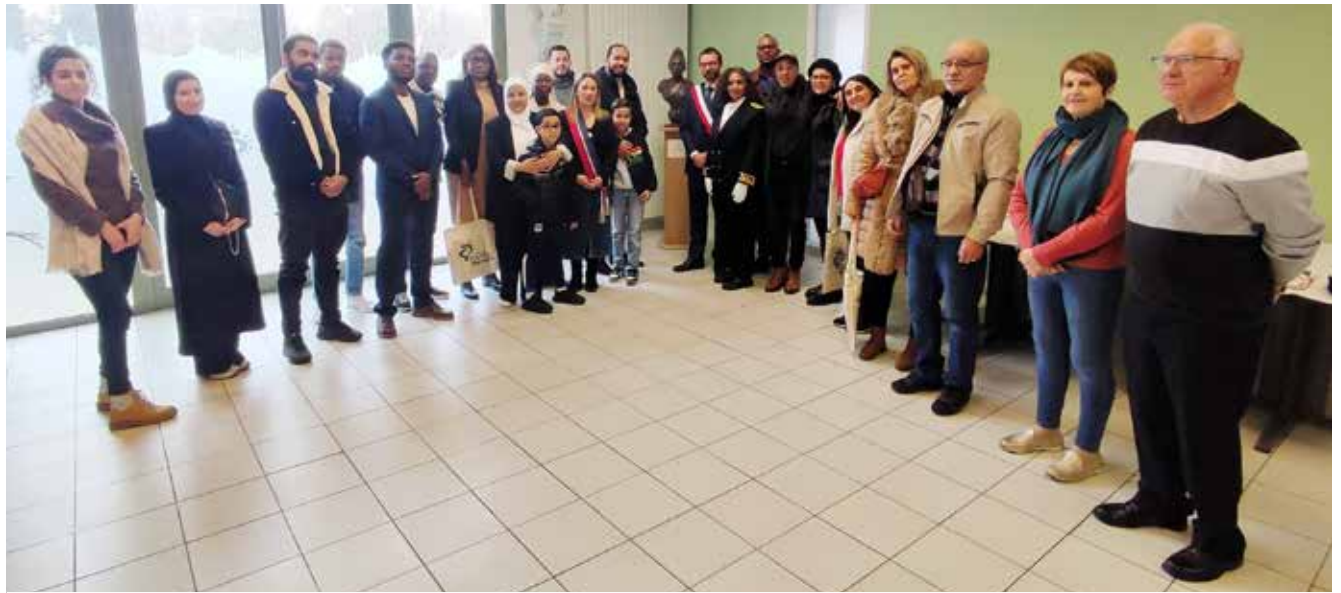
Ensemble pour la photo devant la première Marianne de France à l'effigie de Joséphine Baker.

Entre fierté et émotion, tous ont pu profiter de cet accueil chaleureux dans la citoyenneté française dans la maison de la République. ■