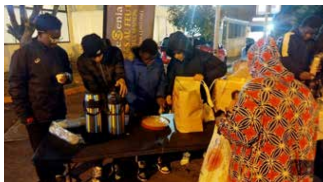
Tout le monde a donné du cœur à l'ouvrage.

De la générosité comme s'il en pleuvait ! ■