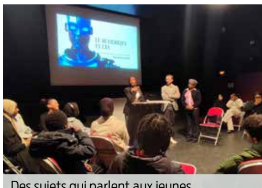
Des sujets qui parlent aux jeunes (avec So'Parks).