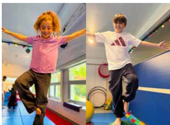
Un peu de sport pour garder la forme.