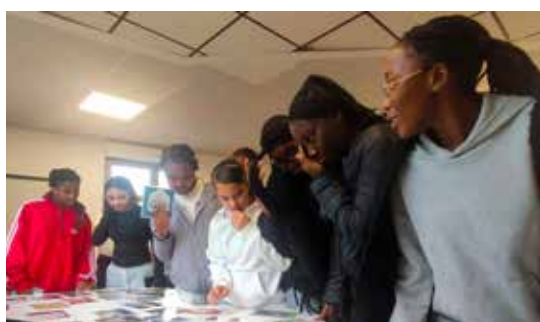
Le 12, les jeunes ont débattu sur leur quotidien avant de visionner le film La Vie scolaire .