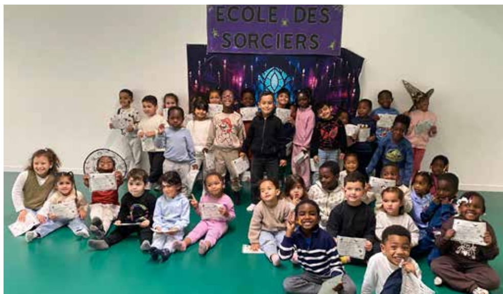
Les enfants de la ville se sont mis sur leur 31... le 31 octobre !