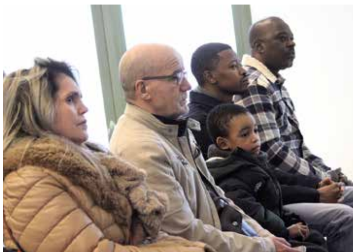
Des familles honorées par cette cérémonie.