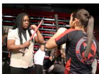
Avec les jeunes de la Team EAKS.