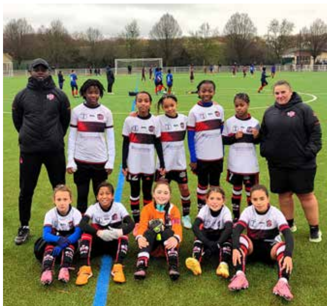
L'équipe U13F du FC Fleury 91 sur le terrain flambant neuf.

Mis en service dès la fin de l'été, le nouveau terrain synthétique du complexe sportif Auguste-Gentelet n'a pas tardé à séduire les graines de footballeurs du FC Fleury 91. Entraîneurs, joueurs et parents louent la qualité de cet équipement qui offre à tous «un grand confort de jeu». Moustapha, entraîneur, le confirme : «On en est vraiment satisfaits, ce terrain change tout pour nos entraîneurs.»