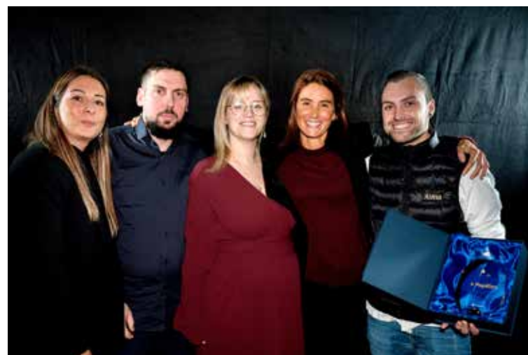
Les restaurants Alma et Nomad posent avec leur trophée Papilles d'or.