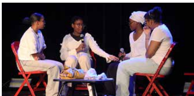
Debout pour elles : le spectacle des enfants des Mahorais Fleurie 91.