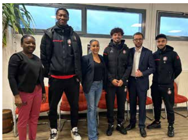
Le FC Fleury 91 et ses talents avec les élus de la ville.