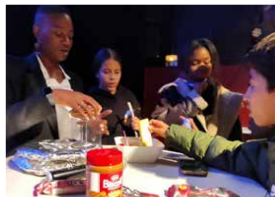
Des moments de partage, durant un mois.