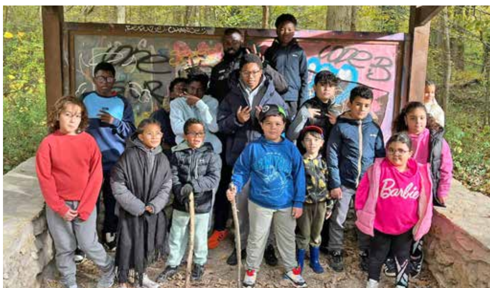
Des Floriacumois de tous quartiers réunis pour une sortie conviviale.

De retour au centre social, la plupart découvre la saveur des marrons chauds. « C'est super bon ! » se réjouit-on. Comme quoi, il suffit parfois d'une idée pour créer des moments forts et découvrir, ensemble, des bonheurs simples comme... manger des châtaignes. ■