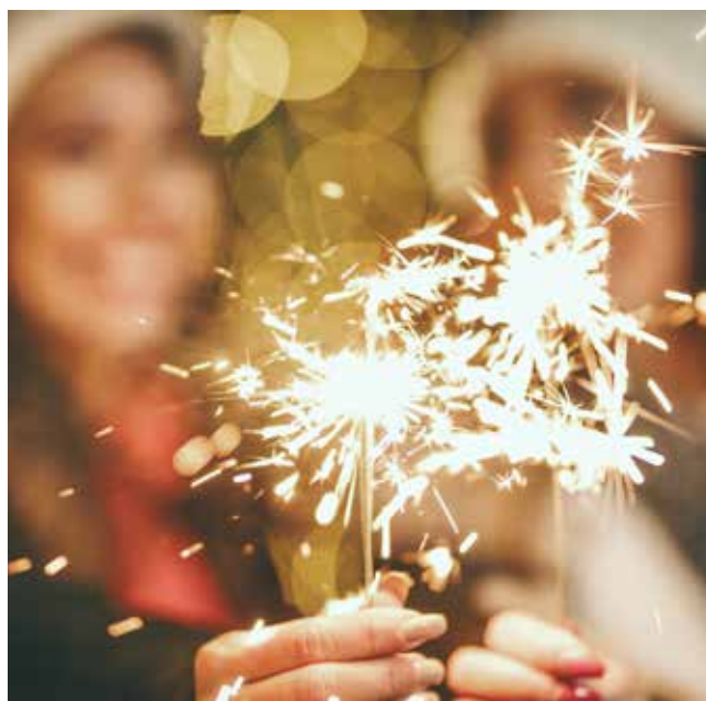
Seuls, en famille ou entre amis, «Nouvel An ensemble» est ouvert à tous les Floriacumois !

* Rens. : Réagir au 06 66 01 74 23 , Reflet d'outre-mer au 06 61 92 62 78 et Secours populaire au 06 52 93 14 89 .