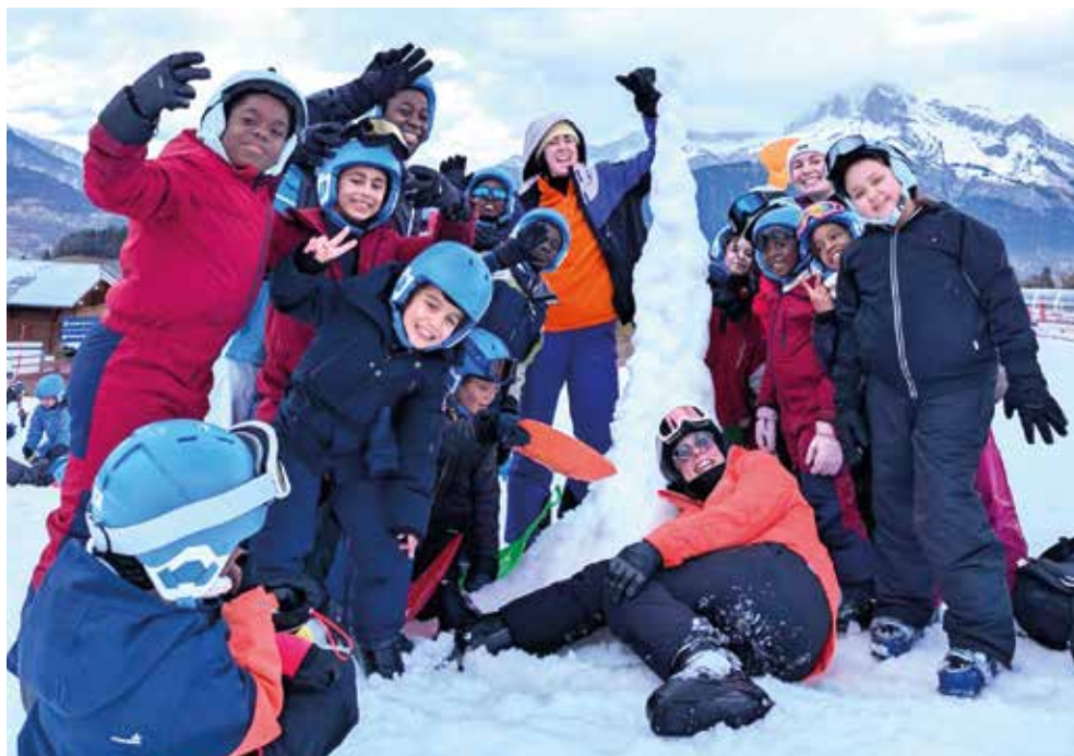
En février 2025, vingt Floriacumois avaient dévalé les pistes hautes-savoyardes.

* Critères de sélection inclus, renseignements au 01 69 46 72 85.