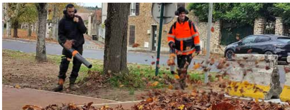
Objectif : sécuriser les voies piétonnes et cyclables (ici, au Village).

tous les autres quartiers de la ville, elles sillonnent les rues pour pallier les caprices de l'automne. Objectifs : assurer la sécurité de tous et préserver un cadre de vie agréable. ■