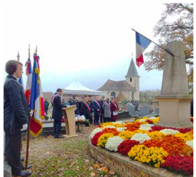
Le 11 novembre, les Floriacumois ont participé à la commémoration.