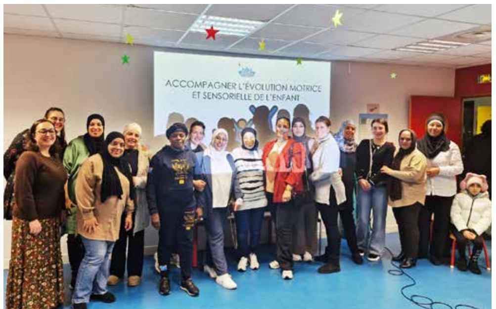
Des assistantes maternelles agréées, formées toute l'année.

En lien avec le Relais petite enfance (RPE), les assistantes maternelles agréées de Fleury-Mérogis partent régulièrement en formation. Le 19 novembre, l'évolution motrice et sensorielle de l'enfant était au programme. De quoi répondre au mieux aux attentes des bébés et de leurs parents, toute l'année. ■