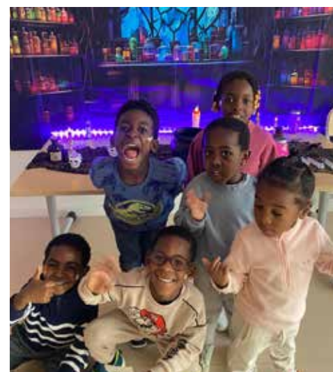
Ambiance garantie pour Halloween.