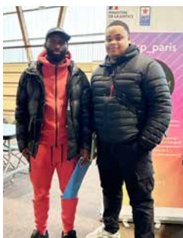
Des entretiens prometteurs.