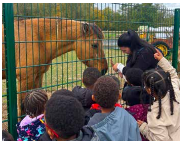
À la rencontre des animaux de la ferme du parc Pierre.