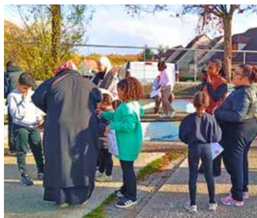
Une chasse au trésor sur le parvis Malraux.

droits tout en s'amusant. Une belle réussite collective qui illustre la créativité, la motivation et l'engagement de ces jeunes animateurs (désormais tous diplômés) en devenir. ■