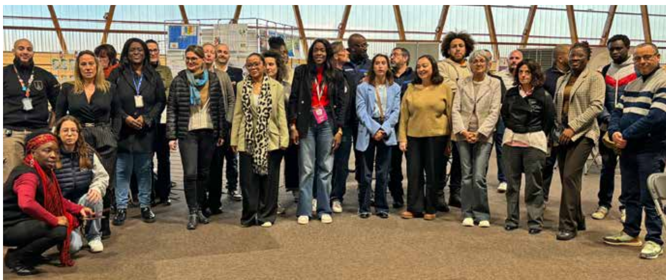
De nombreuses entreprises, des nouveaux partenaires aussi, pour aider les jeunes Floriacumois à trouver leur voie.