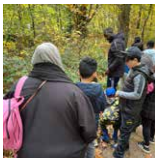
Un bel après-midi pour les familles.