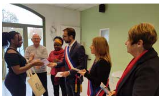
Le 19, les élus de la ville ont remis en main propre, leur carte d'électeur à des jeunes majeurs.