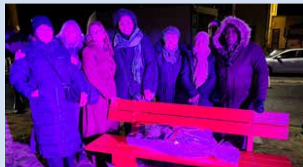
Un banc rouge qui invite au dialogue et qui rappelle la ligne d'écoute : 3919.