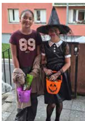
Vive les bonbons !