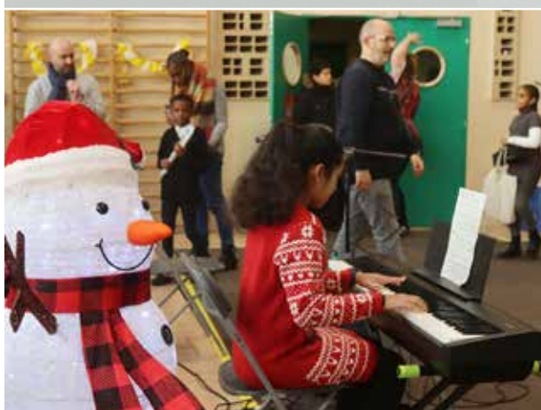
Le CMA sera de la fête en décembre.