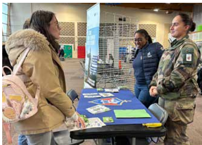
Diverses questions sur le service militaire volontaire.