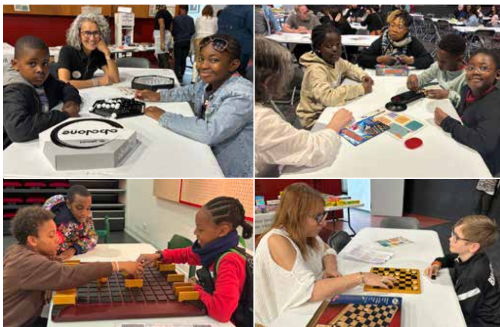
Un rendez-vous très attendu, notamment pour les familles !

F ort du succès rencontré l'hiver dernier, le Festival de jeux de société revient pour une nouvelle édition pleine de surprises. Objectif: se retrouver autour d'une table pour s'amuser. Tout simplement. En partenariat avec la médiathèque et des acteurs locaux, le «Festival» 2026 proposera une sélection de jeux adaptés à tous les âges. Un événement intergénérationnel donc, où seul le