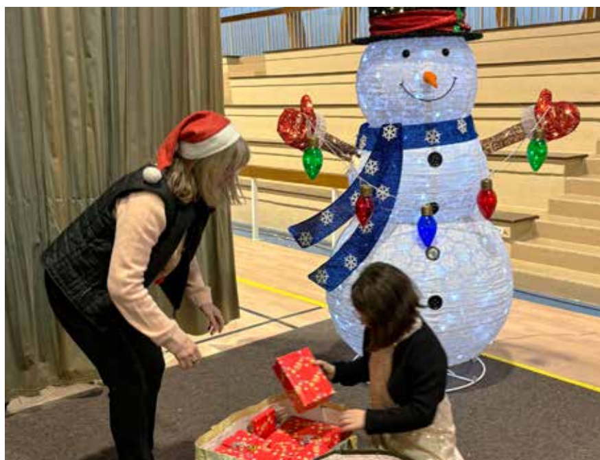
Les fêtes : un moment toujours très attendu pour les enfants, petits et grands.

Chaque mois de décembre, la ville de Fleury-Mérogis s'habille de ses plus belles couleurs pour fêter la fin d'année. Au programme de ces festivités pour tous : Noël Solidaire, marché de Noël, soirée roller, spectacles, animations pour les enfants, concerts, « Nouvel An ensemble ». Joyeuses fêtes à tou(te)s les Floriacumois(e)s !