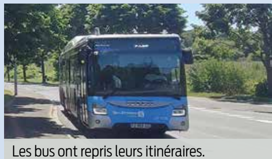
Les bus ont repris leurs itinéraires.

Bonne nouvelle : après 6 mois de travaux rue Roger-Clavier, cette dernière a rouvert à la circulation le 8 décembre . Ce qui permet aux bus de reprendre leur itinéraire classique : les arrêts Mairie, Hôpital Henri-Manhès, ZI des Ciroliers, Clément-Ader et Petits-Champs sont de nouveau desservis. Aussi, les règles de circulation reprennent leur droit comme avant : le pont de la N104 est de nouveau réservé exclusivement aux bus et aux véhicules d'urgence. Soyez vigilants !