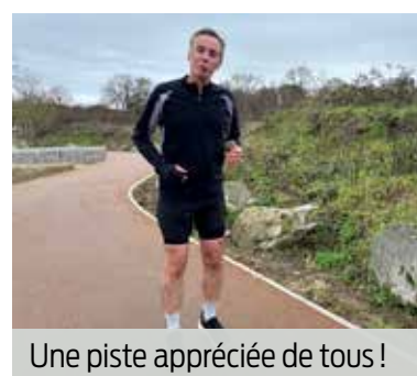
Une piste appréciée de tous !

démarre mon jogging ici. C'est une bonne idée de la ville, les piétons peuvent maintenant marcher loin des véhicules.» «Dimanche, je viens avec les enfants et leur vélo!», promet Romane (quartier des Chaqueux). ■