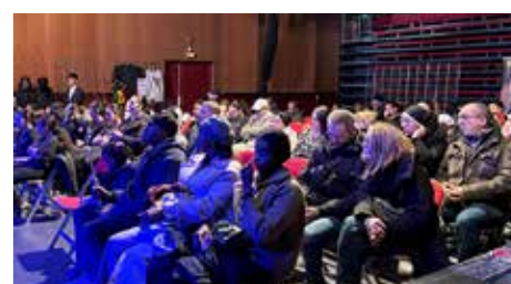
Un public nombreux pour la valorisation des diplômés.