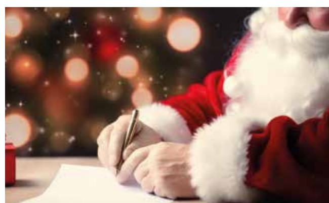
Tous les courriers seront remis au Père Noël.

Comment faire ? Sur l'enveloppe, écrivez simplement «Père Noël» (sans oublier d'inscrire l'adresse de l'enfant au verso pour recevoir une réponse personnalisée) ; la lettre au Père Noël n'a pas besoin de timbre. Un lutin de la Ville fera suivre votre lettre. ■