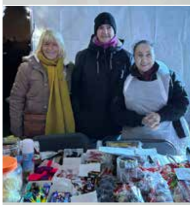
Rendez-vous au marché de Noël les 12 et 13 décembre.