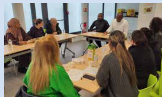
Plusieurs habitantes ont participé aux premières réunions.

membres de l'équipe. Le 14 novembre, un premier groupe s'est réuni pour mettre en place des actions communes. Et ainsi permettre à chacun de faire mûrir ses propres idées.