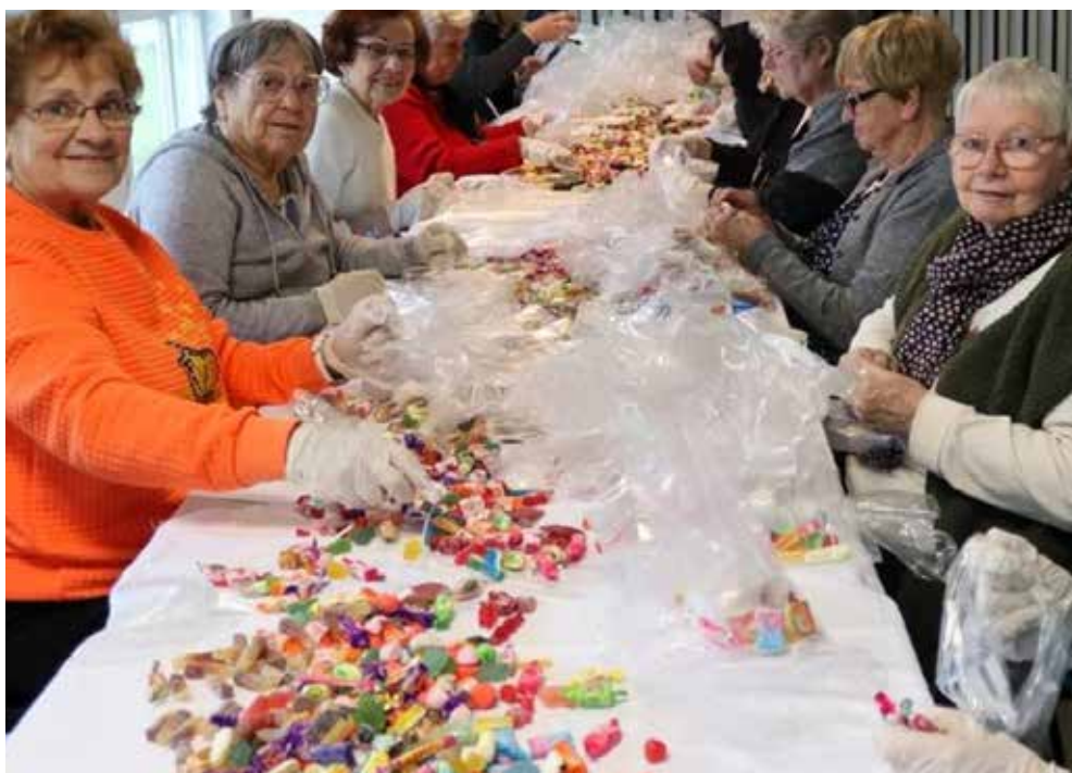
Des bénévoles actifs, ici à la salle Intergénérationnelle.