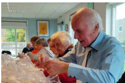
Pour tous, l'objectif est de faire plaisir.