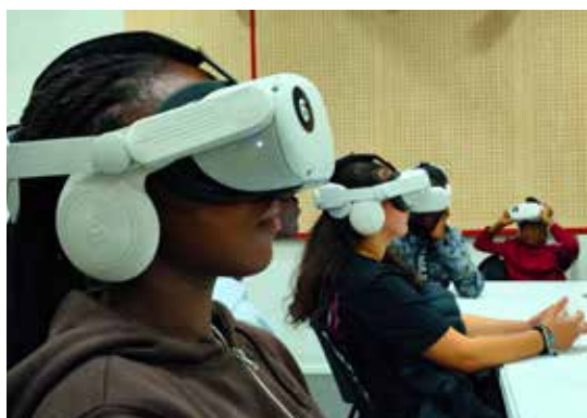
Activité «réalité virtuelle» avec Culture 360.

Outre les deux temps forts qu'étaient le forum de l'emploi et de la formation puis la journée des jeunes talents (cf. pages précédentes), d'autres moments de rencontre et de partage ont marqué cette 3 e édition du Mois de la Jeunesse à Fleury-Mérogis. Autant de rendez-vous pour se retrouver, s'encourager et partager des histoires inspirantes. Pour célébrer ensemble la jeunesse floriacumoise résolument tournée vers l'avenir.