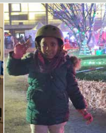
La soirée roller très attendue !