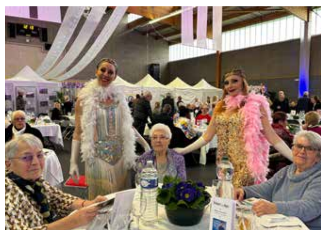
Un moment festif pour tou(te)s (archives 2024).

Pour la nouvelle année 2026, le banquet des aînés aura lieu le mardi 20 janvier.