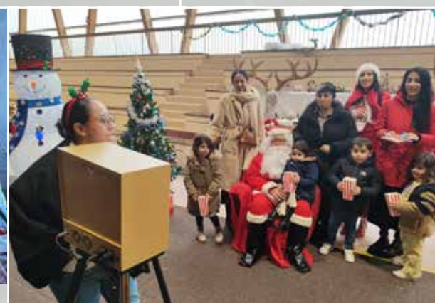
Le Père Noël sera, lui aussi, présent.