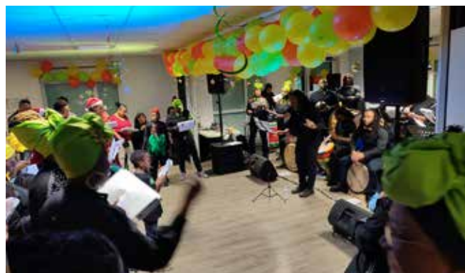
Ambiance garantie avec Bwa Bandé !

► Chanté Nwèl avec Bwa Bandé sam. 20 décembre à 20h salle Intergénérationnelle (près du gymnase)