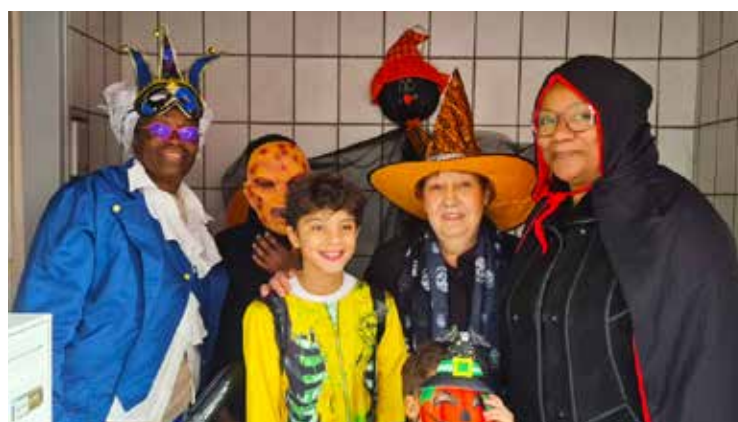
Une belle initiative organisée par la CNL aux Résidences.