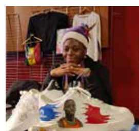
Entrepreneuse de talent.