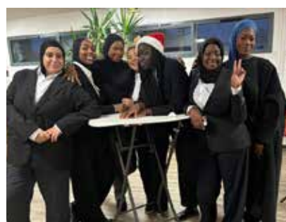
Des jeunes au talent fou, toute la journée.