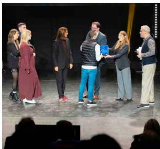
Remise des trophées des Papilles d'or aux restaurants Nomad et Alma.

À l'occasion de la cérémonie des Papilles d'or qui récompense les meilleures adresses gourmandes de l'Essonne, deux restaurants de la ville ont été récompensés. Un grand bravo au restaurant Nomad (cuisine en majorité bio et souvent locale) et au restaurant Alma (cuisine bistrannique inspirée du régime méditerranéen), tous deux primés. ■