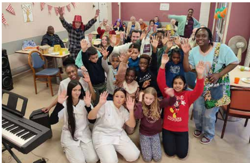
Jeunes artistes et aînés, prêts à partager encore de beaux moments.

Ils l'ont fait ! Le 26 novembre, les jeunes pianistes et batteurs du Centre musical et artistique (CMA) ont donné un concert aux aînés de l'Ehpad Marcel-Paul. Une heure de musique, de joie et de bonne humeur pour ce doux moment 100% intergénérationnel. De traditionnels chants de Noël aux incontournables de la musique classique en passant par... Gims, les aînés de l'établissement ont poussé la chansonnette jusqu'à rejoindre la piste de