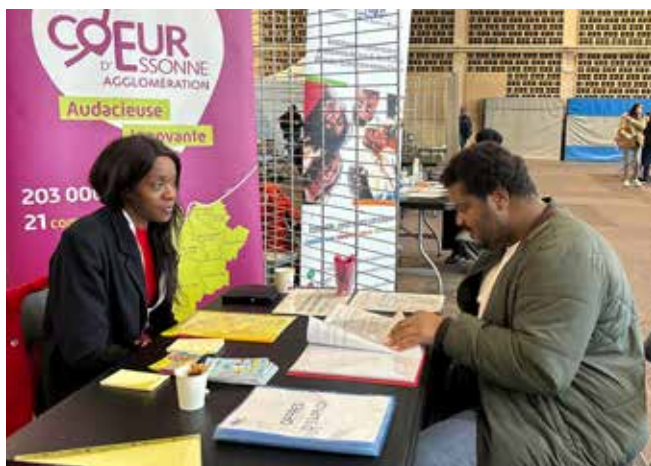
Des échanges toute la journée.