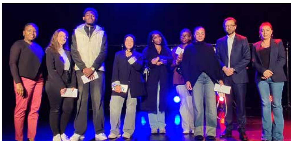
Les bacheliers et autres diplômés post-bac étaient aussi mis à l'honneur.