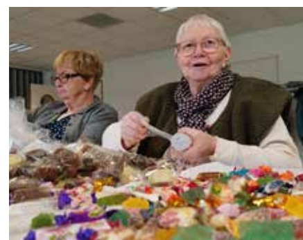
Les paquets de bonbons sont prêts!