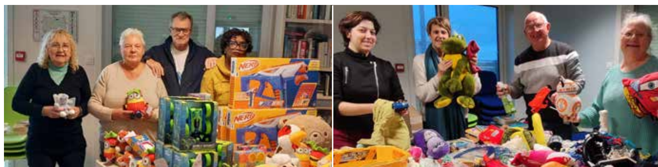
De nombreux Floriacumois ont déposé une myriade de jeux et jouets.

tout les jouets de mon petit frère. Je parle beaucoup de cette initiative solidaire autour de moi. J'avais envie de faire plaisir aux enfants, c'est important pour moi.» ■