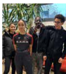
Rencontres et partage.