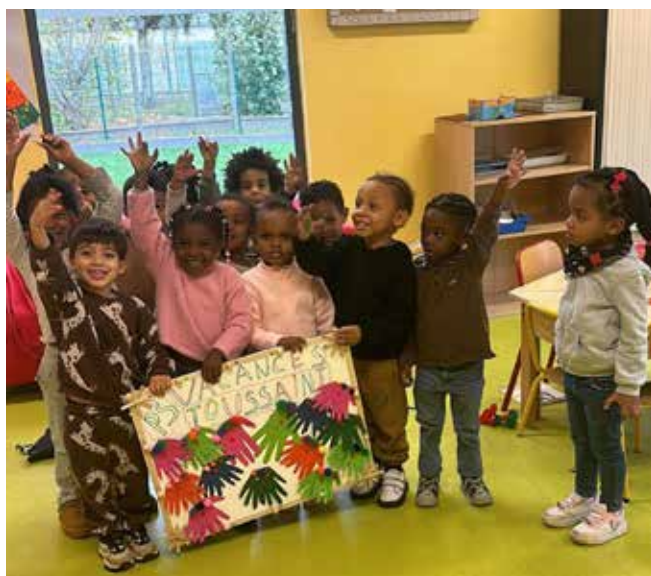
Vive les vacances chez les maternelles.

la pression avec des sorties nature, au bowling ou sportives. Après le retour sur les bancs de l'école, place... aux fêtes de fin d'année. ■