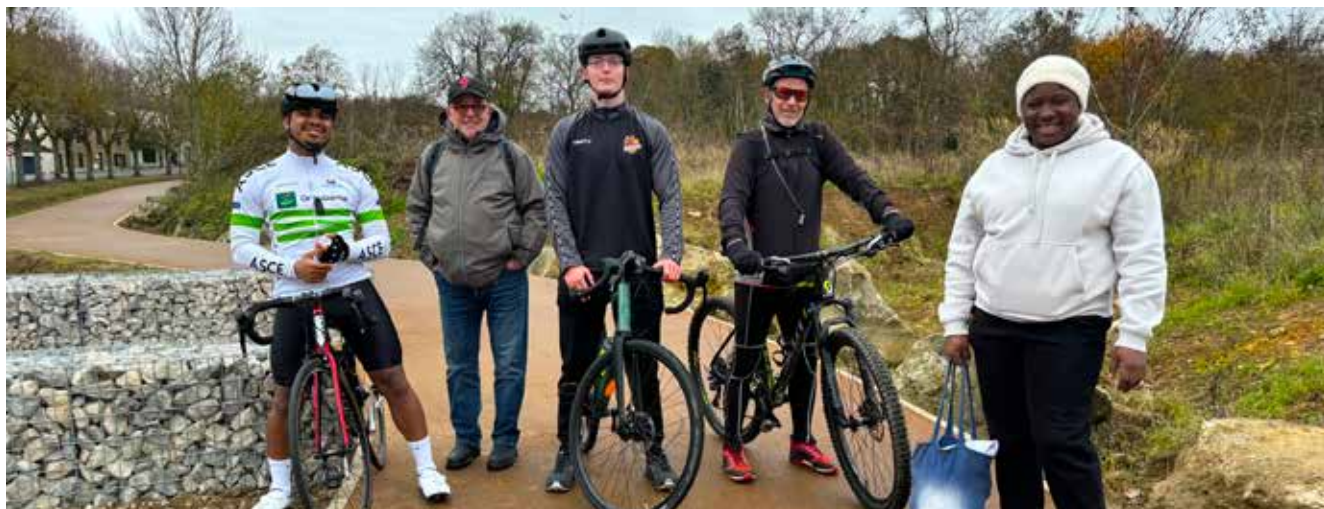
Une piste partagée pour les piétons, les cyclistes et les joggeurs.