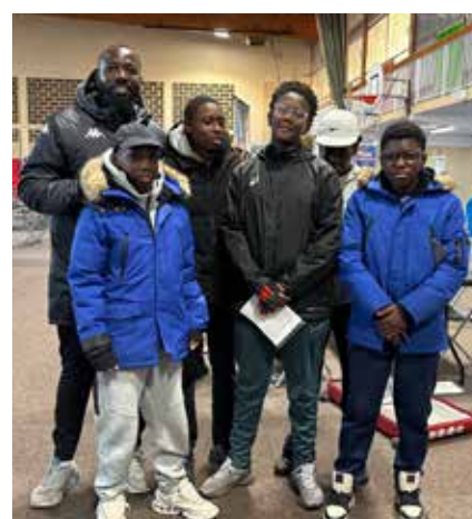
Les plus jeunes se renseignent.