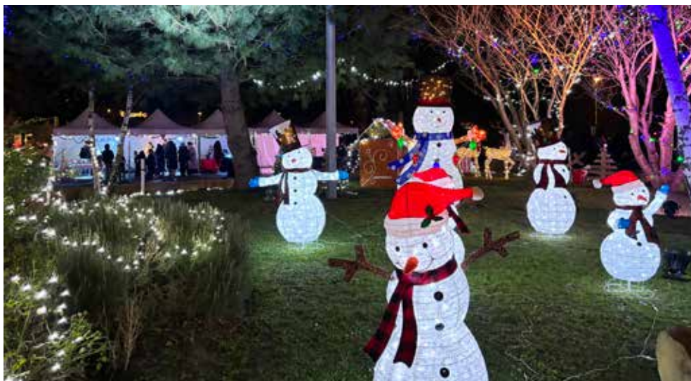
Les illuminations de Noël seront dévoilées le 12 au soir.

2 e édition du Réveillon du nouvel an le 31 décembre , salle Malraux (uniquement sur inscription, cf. page 9). ■