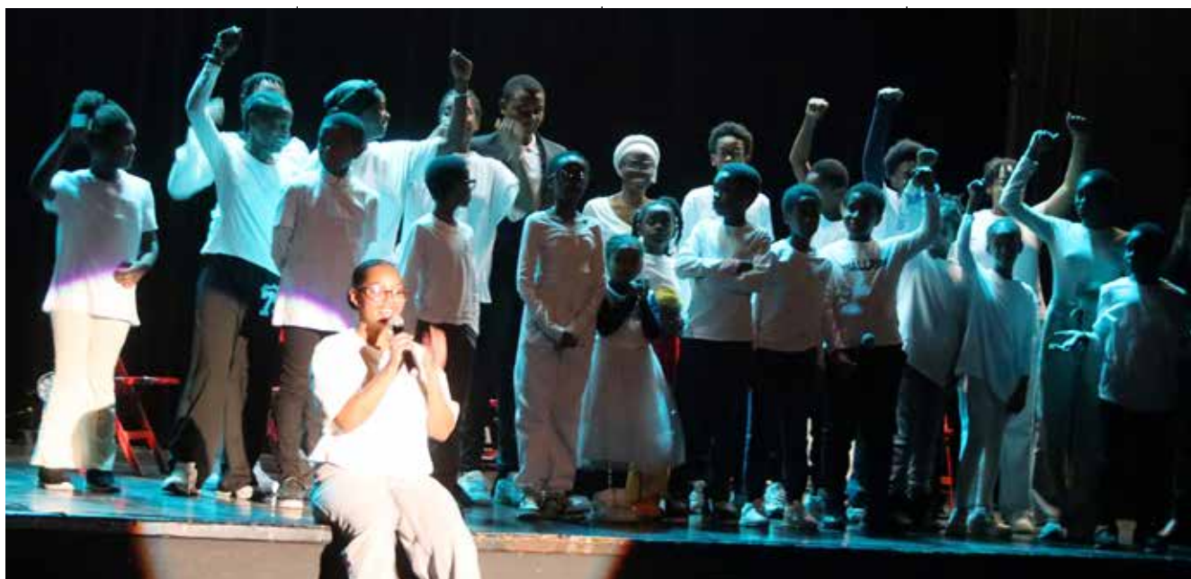
Tou(te)s le point levé contre les violences faites aux femmes !

Sur la scène, ce sont les enfants qui prennent la parole. Dans un spectacle intitulé Debout pour elles , ils se succèdent avec leurs textes poignants qui retracent la vie d'un couple, d'une famille où grandit ce sentiment d'insécurité, de violences extrêmes. Avec conviction, les jeunes Mahorais de l'association floriacumoise veulent, ensemble, dénoncer