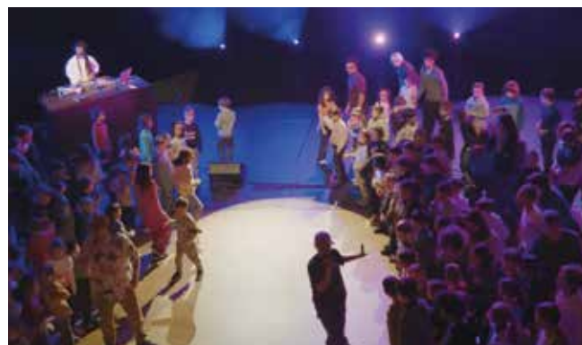
Chantez, bougez, découvrez les bases du hip-hop !

► Boumshakalaka Compagnie Boumboxeurs Mercredi 4 février 14h30 Salle Malraux