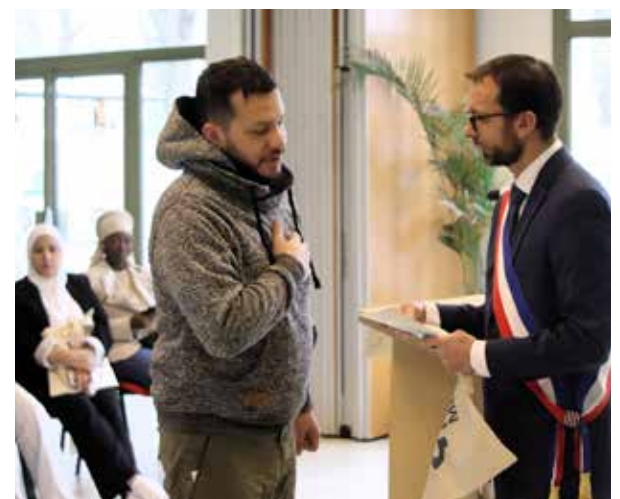
Un honneur pour ces Floriacumois.