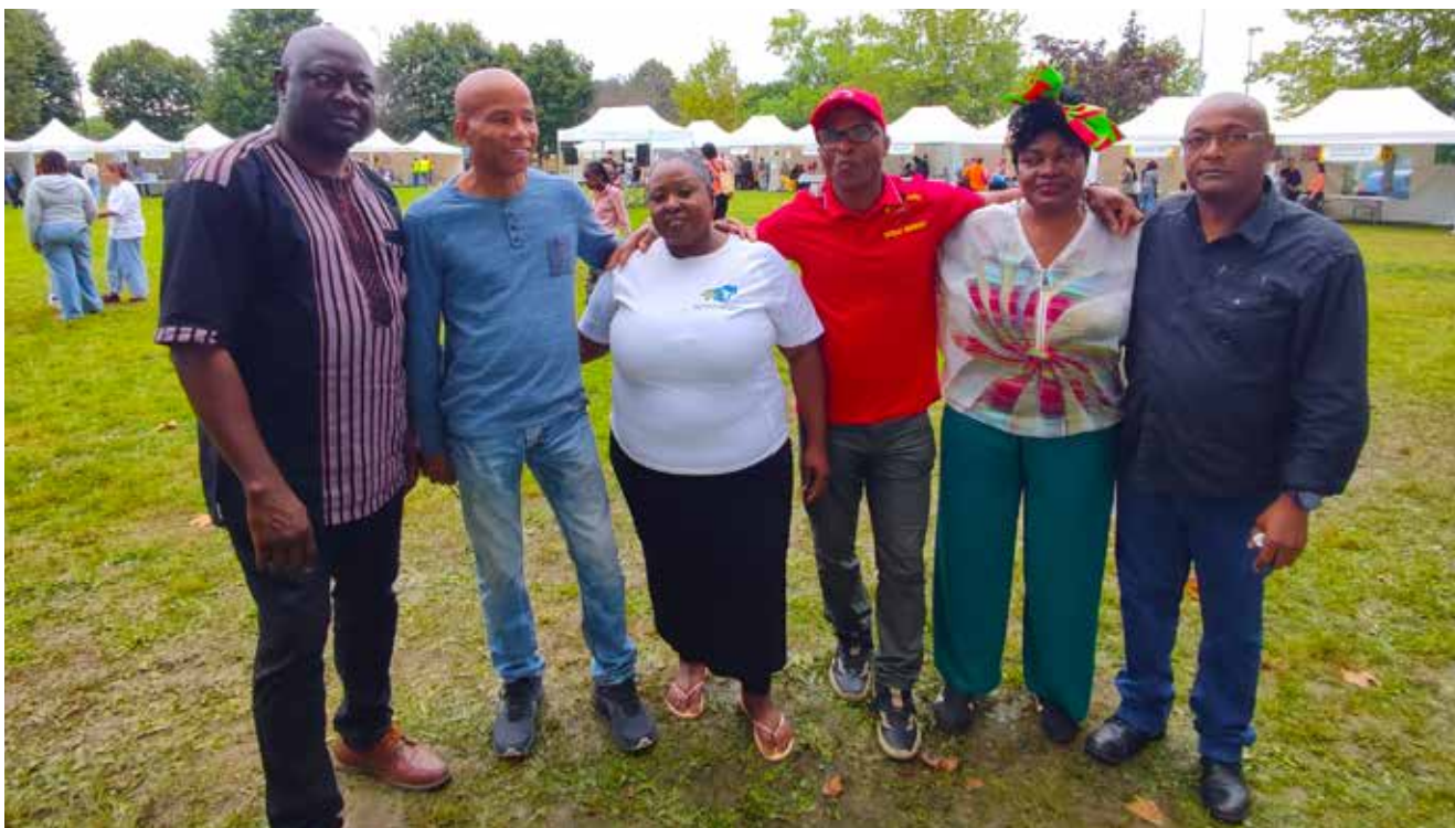
← Quand quatre associations culturelles de la ville se rassemblent pour une photo commune, main dans la main. Une nouvelle année pleine de projets pour les associations Mahorais Fleurie 91, Réagir, Reflet d'outre-mer et SAO-Culture.