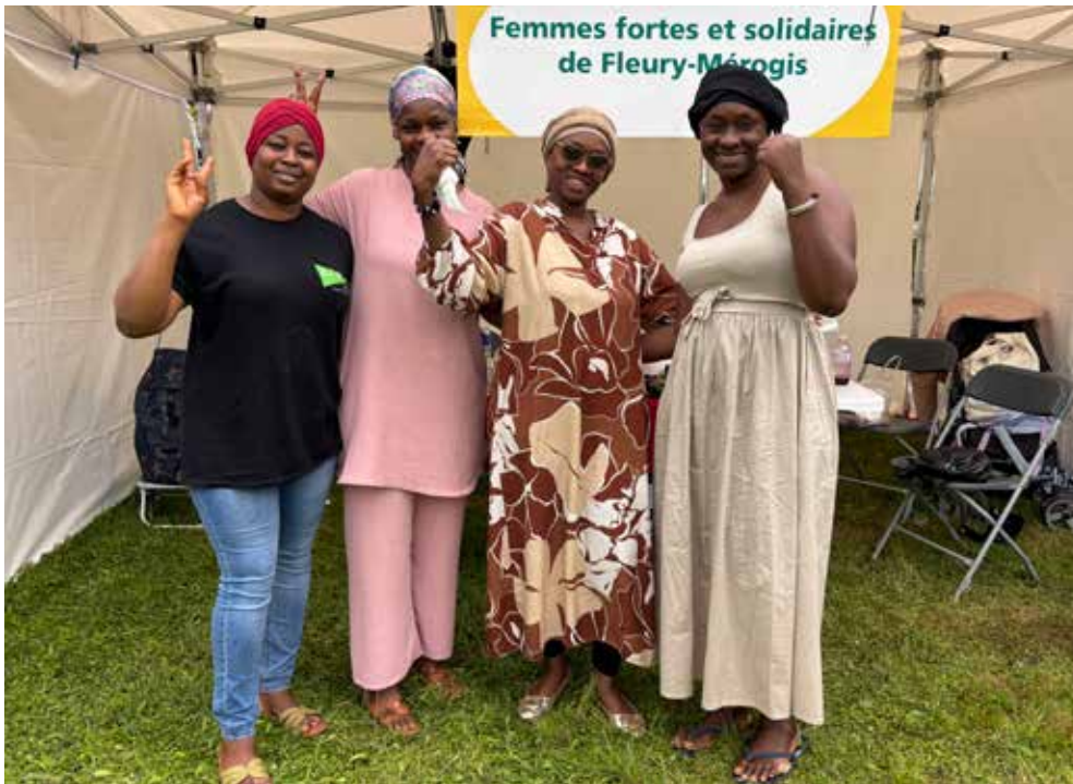
↑ Des sourires, en veux-tu, en voilà. Comme ici, avec l'association Femmes fortes et solidaires de Fleury. Merci à elles et belle année d'actions solidaires !