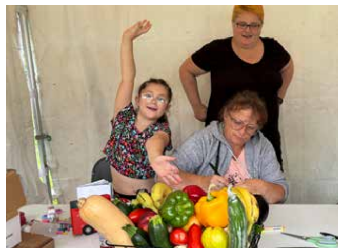
← La même ferveur sur la cinquantaine de stands présents le 7 septembre. À l'image de l'association La Graine Fleury, les bénévoles ont accueilli les Floriacumois et leur ont expliqué leur projet pour cette nouvelle année 2024-2025. Merci à eux !