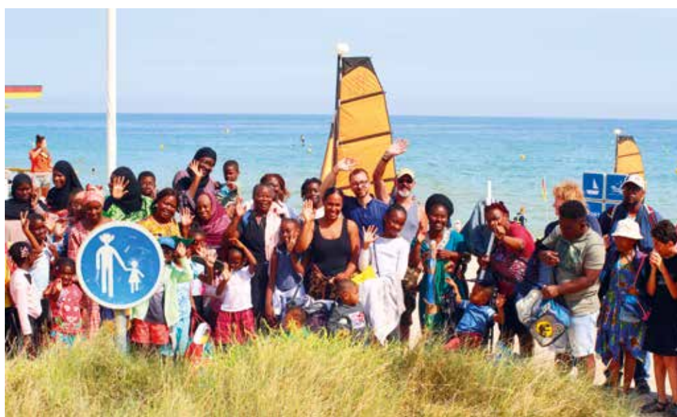
Des sorties pour tous les Floriacumoïses : un plaisir partagé !

* Plus d'informations dans le prochain Fleury ma ville .