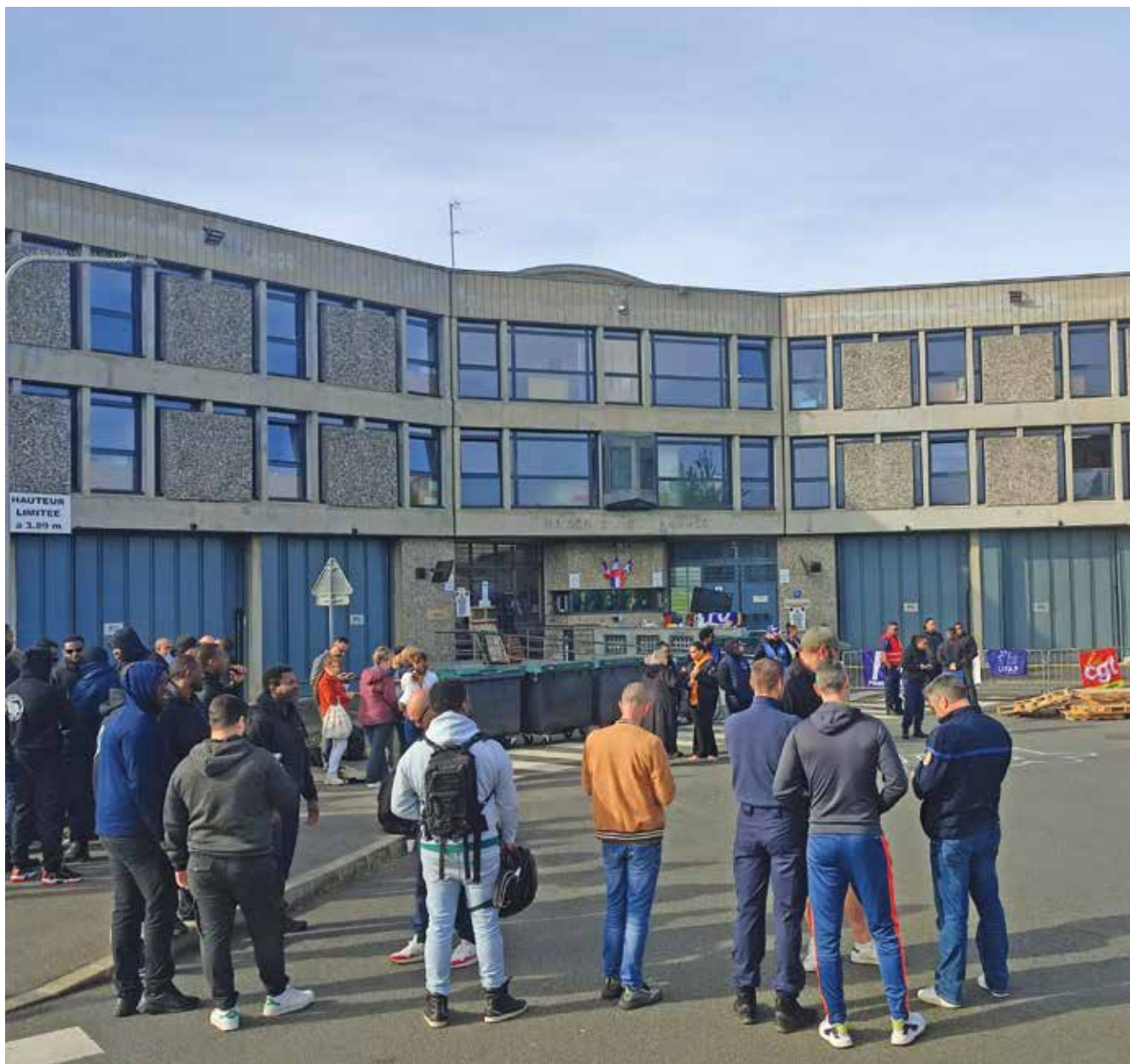
Rassemblement le 15 mai devant la Maison d'arrêt. L'émotion était au rendez-vous.