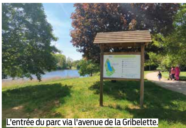
L'entrée du parc via l'avenue de la Gribelette.

contres qu'on y fait. En ce long "viaduc" de printemps, une maman s'y promène avec ses enfants : « J'ai de la chance car je ne travaille pas aujourd'hui et il fait beau. Les enfants peuvent courir, profiter de cet espace vert, son aire de jeux. On vient souvent pique-niquer ici, en famille. » En se baladant dans le parc, des groupes sont installés à l'ombre des arbres. Près de l'aire de jeux, Ahmid est venu avec ses amis : « On vient souvent ici. C'est agréable, on a l'impression d'être à la campagne alors que les HLM sont juste à