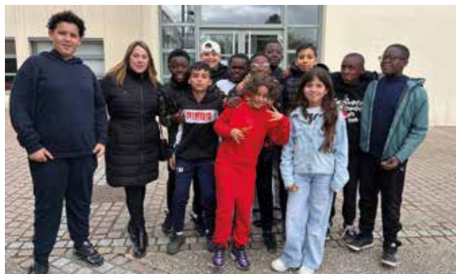
De nombreux jeunes ont suivi le match sur écran géant.