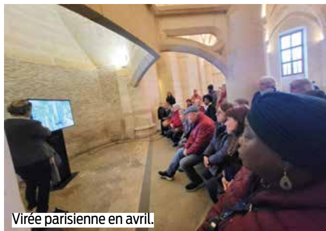
Virée parisienne en avril.

Après les sorties estivales proposées par la Ville (cf. p.9), rendez-vous le 19 septembre pour découvrir la manufacture de Sèvres et son événement "Sèvres se dévoile". Inscriptions en mairie du 3 au 8 juin . Tarifs : de 3,60 à 18€ (selon quotient familial). ■