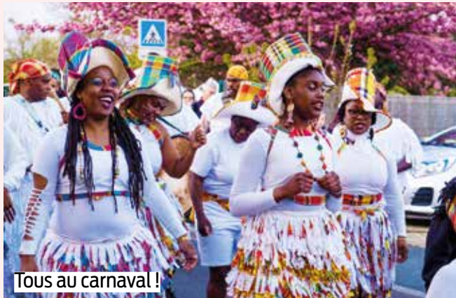
Tous au carnaval !

Bonne nouvelle : le Carnaval nocturne aura bien lieu. Suite à son report en avril, les services municipaux et les associations hyper-actives de la ville se sont retroussés les manches pour trouver une nouvelle date : ce sera le 15 juin. Le programme est inchangé : village récréatif à l'espace Malraux dès 16h (ma-