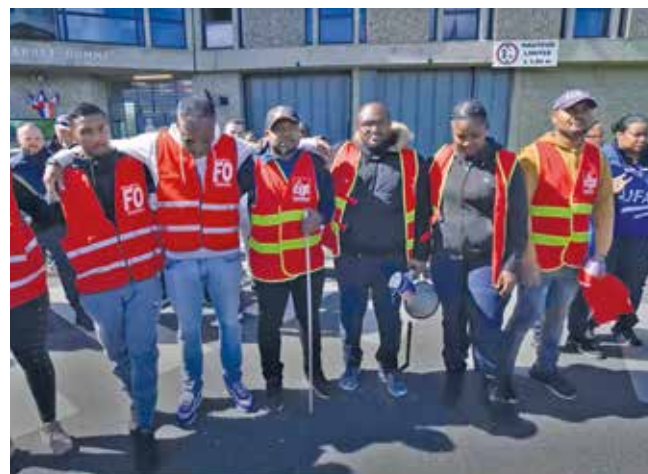
Les syndicats étaient tous réunis pour observer une minute de silence.

vier Corzani et plusieurs élus de la Ville ont pu rencontrer ces femmes et hommes qui travaillent jour et nuit au service de la Justice: «Avec les élus de la municipalité, nous sommes présents ce jour devant