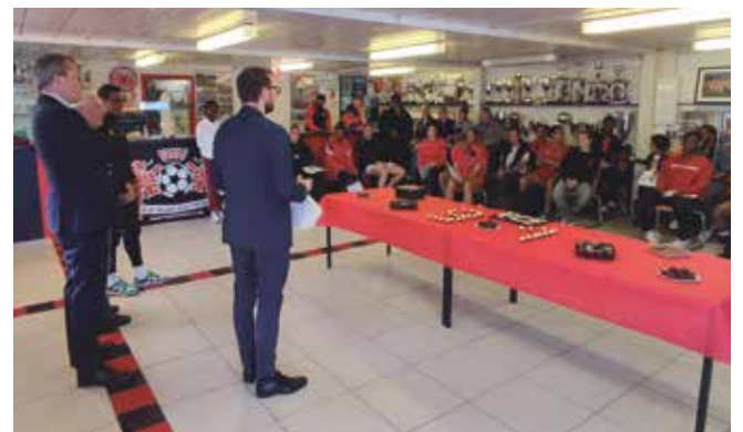
Des Floriacumaises félicitées à leur retour à Fleury.