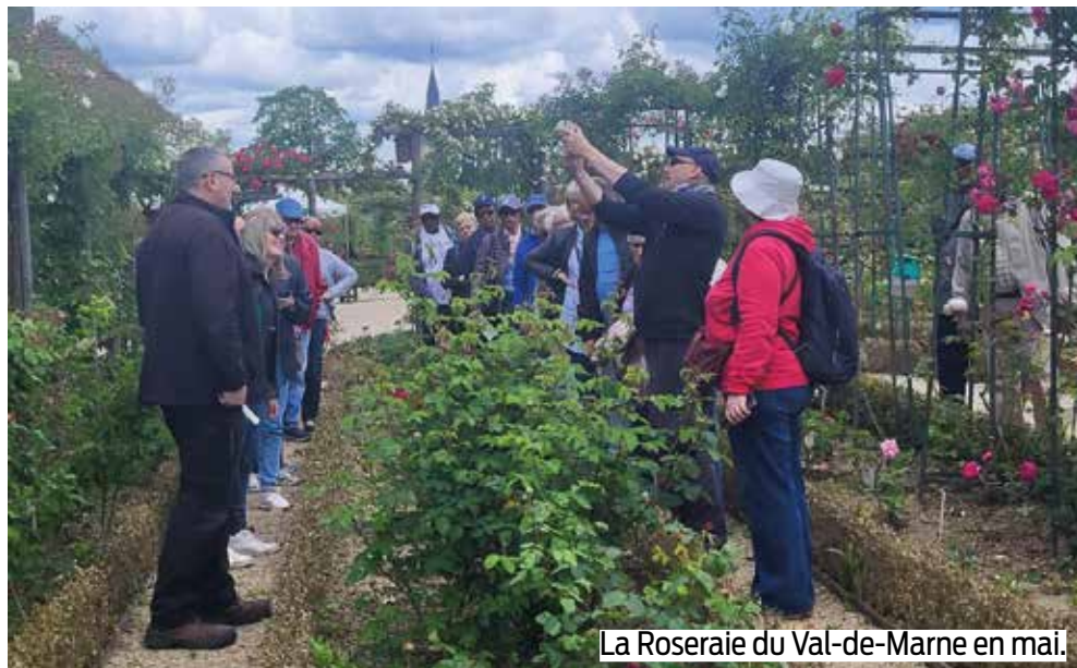
La Roseraie du Val-de-Marne en mai.

E n avril, ils ont ainsi visité deux illustres monuments de l'île de la Cité, à Paris : la Sainte-Chapelle et la Conciergerie. Avant de se rendre dans un lieu plus poétique le 17 mai dernier : la Roseraie du Val-de-Marne. Des lieux bien différents, mais ô combien surprenants. C'est ce qui fait la force des sorties proposées aux seniors. Cet été, d'autres sorties (intergénérationnelles) sont prévues. En septembre, l'aventure continuera avec, au programme, la manufacture de Sèvres.