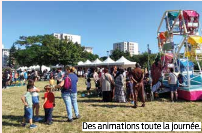
Des animations toute la journée.

Fleury en fête Samedi 22 juin de 10h à 20h Coulée verte