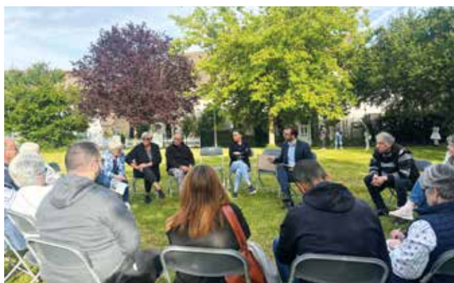
Les comités de quartier sont un véritable temps d'échanges offert à tous les habitants.

Depuis 5 ans, les comités de quartier sont des lieux de démocratie participative où les Floriacumois peuvent exprimer leurs attentes et émettre leurs idées. Objectif : améliorer la vie du quartier. Les premières réunions de mai ont conforté cette idée d'échanges constructifs entre les habitants et leurs élus. Comme lors de la première réunion des Joncs-Marins où la nouvelle Amicale des locataires