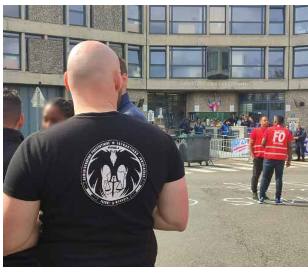
« Ce qui est arrivé dans l'Eure à nos collègues du PREJ de Caen aurait pu nous arriver. »