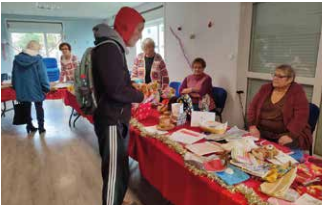
Vente de Noël de l'association, le 26 novembre.

Contact : par téléphone au 07 70 47 16 08 ou le lundi à la salle intergénérationnelle.