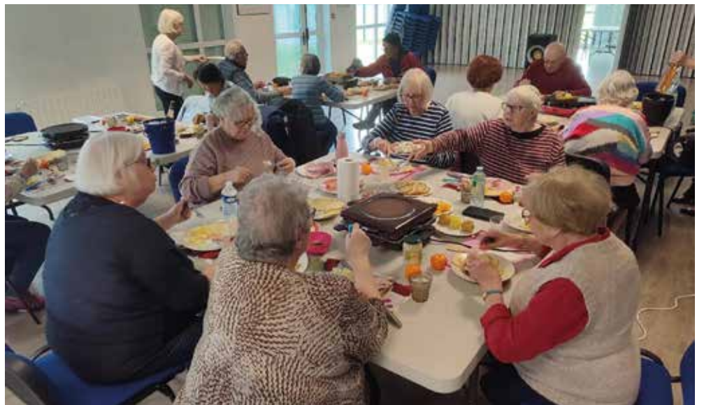
Amitié, rencontre, convivialité... Le lundi, tout est permis !

femmes seules, des personnes pas toujours en bonne santé. Ici, on parle de soi, il y a beaucoup d'écoute. On consolide les liens, voilà tout. » La recette paraît simpliste, elle a pourtant un succès fou : chaque lundi, à l'Espace intergénérationnel, les retraités se retrouvent dans la joie et la bonne humeur. C'est tout. Et c'est très bien ainsi. Consolider les liens : tel est donc, aujourd'hui, le leitmotiv de l'association. Le lundi, "Parole et équilibre" se transforme,