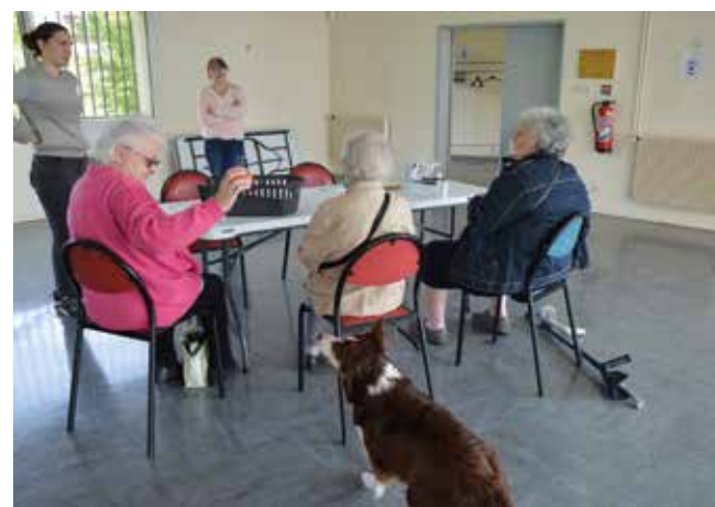
Avril 2022 : atelier de médiation animale avec un groupe de retraitées.

Vous pouvez également y répondre en ligne sur le site fleurymerogis.fr rubrique Services municipaux puis Santé.