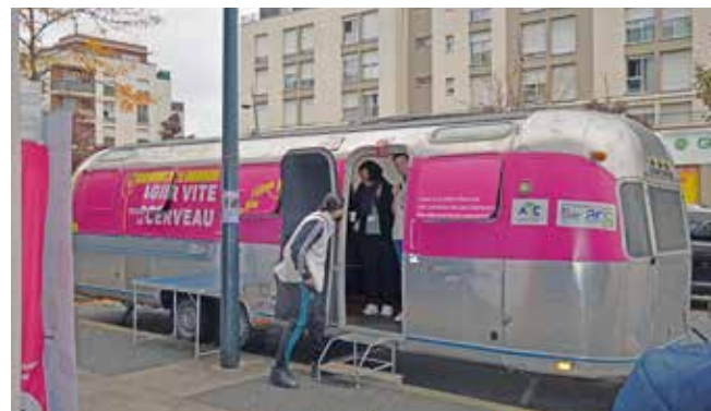
Le 13 octobre 2022, Fleury-Mérogis accueillait le bus AVC. Une des nombreuses actions de prévention.

plifier nos actions et les partenariats noués pour répondre aux besoins en matière de soin et de prévention. Nous avons lancé un questionnaire auprès des Floriacumois dans la perspective de proposer une mutuelle solidaire à coût moindre. Et nous ne perdons pas de vue l'objectif de créer un Centre municipal de santé. ■