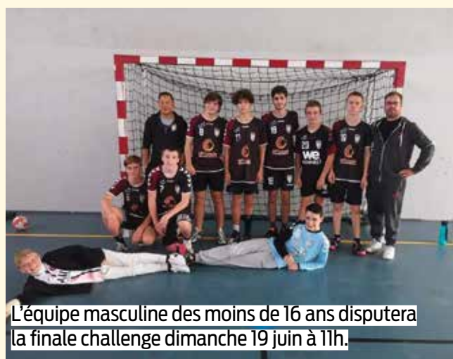
L'équipe masculine des moins de 16 ans disputera la finale challenge dimanche 19 juin à 11h.

« Le MFHB c'est 250 adhérents, plusieurs équipes au sommet des classements et un groupe dirigeant qui cultive la convivialité. »