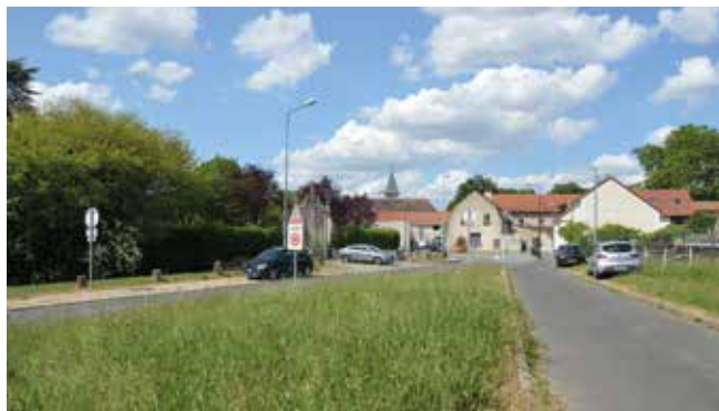
Rue Roger-Clavier, 19 places de stationnement sont créées à proximité de la salle des familles et du centre de loisirs.

Chaque jour, des dizaines de véhicules empruntent la rue Roger-Clavier. Voitures, bus et vélos se pressent dans cette ancienne route étroite qui traverse le quartier du Village. A proximité de la passerelle, les places de parking y sont insuffisantes et le station-