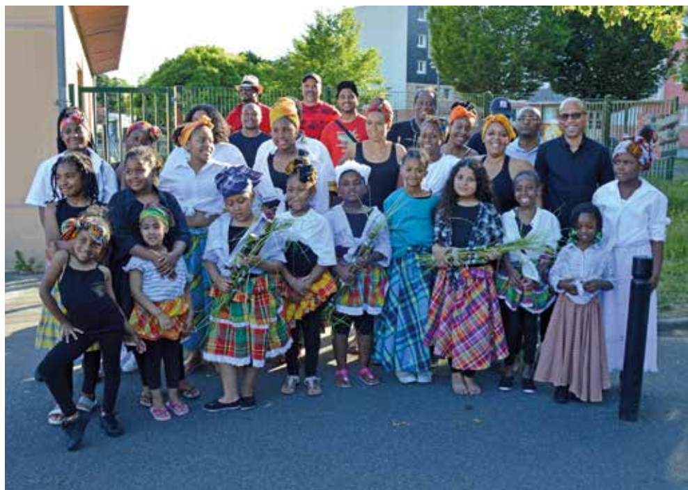
Le 21 mai 2022, les musiciens et danseurs de l'association présentaient un spectacle pour la fête de l'abolition de l'esclavage.

En mai dernier, par exemple, l'association organisait une grande fête autour de l'abolition de l'esclavage. Un groupe de musiciens, une quinzaine de danseuses de 5 à 14 ans et un danseur de 18 ans présentaient un spectacle retraçant l'histoire de l'esclavage. Devant une salle Malraux en surchauffe, ils ont dres-