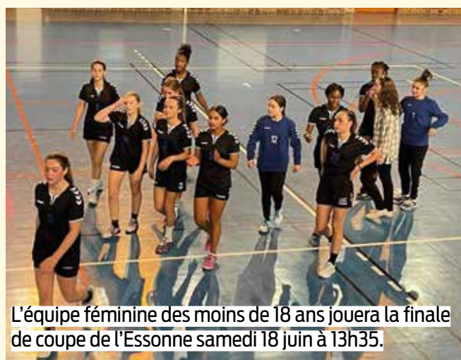
L'équipe féminine des moins de 18 ans jouera la finale de coupe de l'Essonne samedi 18 juin à 13h35.