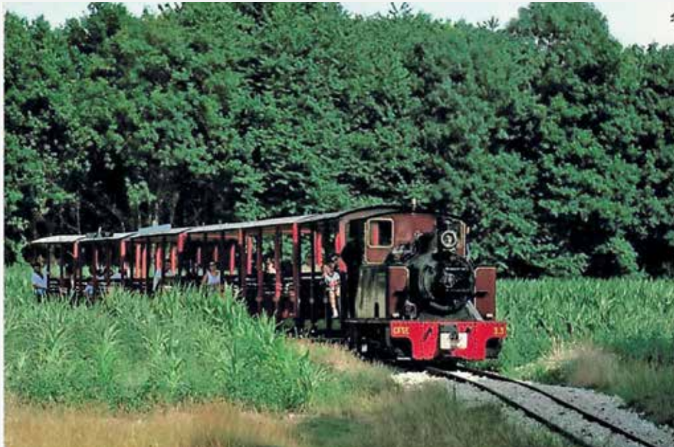
Le petit train de Saint-Eutrope est inauguré en avril 1978. Dès la première semaine, il accueille 3000 visiteurs. Il fonctionnera jusqu'au début des années 2000.

« U n train à vapeur à l'orée d'une ville nouvelle, ça n'est pas banal », lit-on dans le journal La Vie du rail en mai 1978. Le petit train de Saint-Eutrope vient tout juste d'être inauguré et en effet, à deux pas de l'autoroute et de l'hippodrome de Bondoufle, on voit apparaître au détour d'un bosquet une locomotive à vapeur, rutilante, crachant une épaisse fumée blanche. C'est le tout premier train touristique en traction vapeur de la région parisienne. Le départ a lieu sur la commune de Ris-Orangis, face à