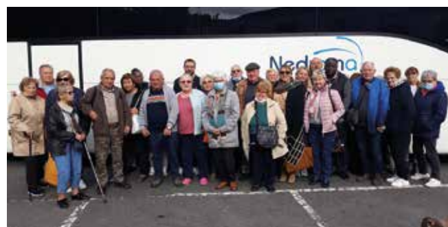
Retour de voyage en novembre 2021.

soi. Nous voulons aider les personnes âgées à lutter contre les effets du vieillissement et leur permettre de rester le plus longtemps possible à leur domicile. Les retraités peuvent également trouver des conseils auprès du service pour faire face à leurs problèmes. Nous travaillons en étroite collaboration avec le CCAS notamment pour aider les retraités à accéder à leurs droits. Même si ça ne concerne pas directement les compétences de la Ville, on pourra les orienter vers la bonne structure.»