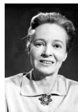
Marie-Claude Vaillant-Couturier, journaliste, résistante, déportée, fut l'une des 33 premières femmes élues députées en 1946.

Pour les législatives (scrutin uninominal) la loi n'est qu'incitative. Les formations politiques qui ne présentent pas autant de femmes que d'hommes sont pénalisées financièrement. En 2017, 224 femmes ont été élues députées, 38 %, un record... Fera-t-on mieux en 2022 ? ■