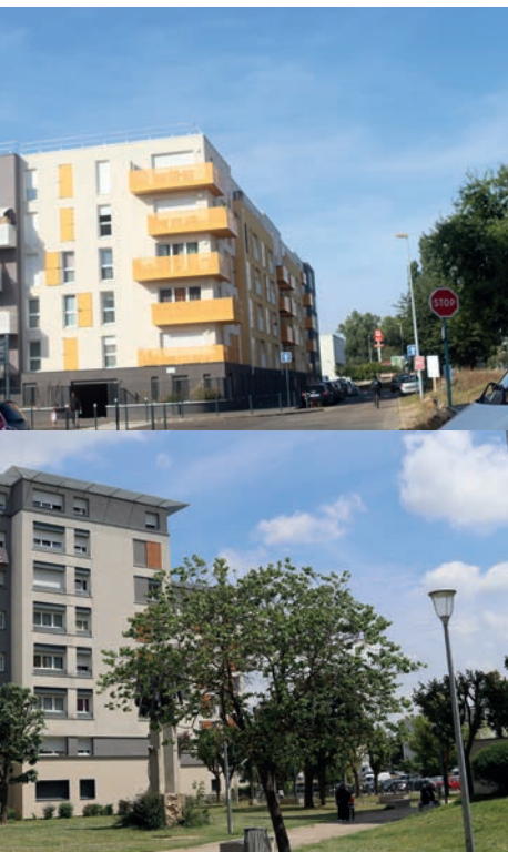
thermie d'ici 2025.