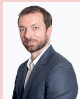
LE MOT D'OLIVIER CORZANI, MAIRE DE FLEURY

de l'État et de la Chambre régionale des comptes. Elle est administrée par un conseil d'administration représentatif de ses actionnaires. Les habitants usagers du réseau y sont représentés par un comité des usagers grâce auquel ils sont systématiquement consultés sur les décisions importantes et peuvent être force de propositions. ■