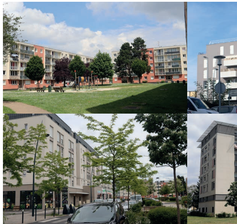
L'ensemble des logements collectifs sera raccordé au réseau de géot

Le 1 er février, la Maison d'arrêt de Fleury a été raccordée au réseau public de géothermie auquel la Ville a adhéré en 2020. C'est la première étape d'un chantier qui verra, d'ici 2024, raccorder l'ensemble des équipements publics et immeubles collectifs à cette énergie renouvelable et à l'abri des fluctuations boursières qui font flamber les factures. Qu'est-ce que la géothermie ? Quels sont ses avantages ? Comment le réseau est-il géré ? Quelles sont les prochaines étapes ?