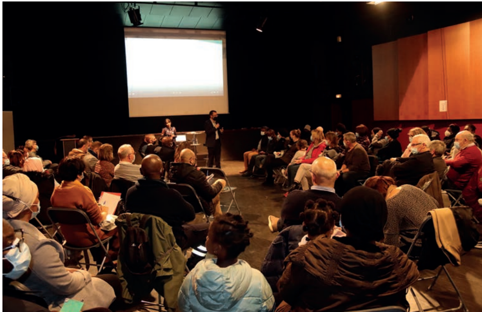
La réunion publique du 19 novembre 2021 salle André-Malraux.

Fleury a changé. Un nouveau quartier a vu le jour, des habitants sont arrivés, la population s'est rajeunie... Les expériences de vie des uns et des autres sont diverses, leurs regards convergent ou se confrontent... Les besoins et les attentes se diversifient. C'est ce constat qui a conduit la municipalité à lancer, à l'automne 2021,