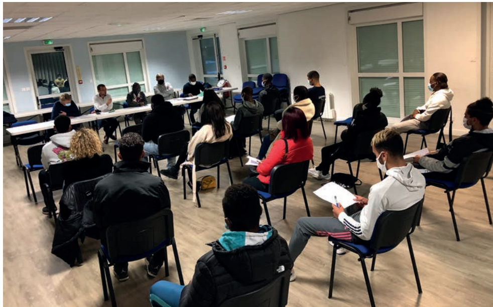
La promo 2020 des stagiaires se préparant à passer le diplôme du Bafa.

L e Brevet d'aptitudes aux fonctions d'animateur est un diplôme qui permet d'encadrer des groupes d'enfants et d'adolescents dans les accueils collectifs pour mineurs, c'est-à-dire de travailler dans les centres de loisirs ou lors des séjours en colonie de vacances. La Ville de Fleury-Mérogis a décidé de participer au financement de cette formation à hauteur de 60% du montant total. Le reste à charge pour les jeunes est donc de 200 €, qu'il s'agisse de la partie