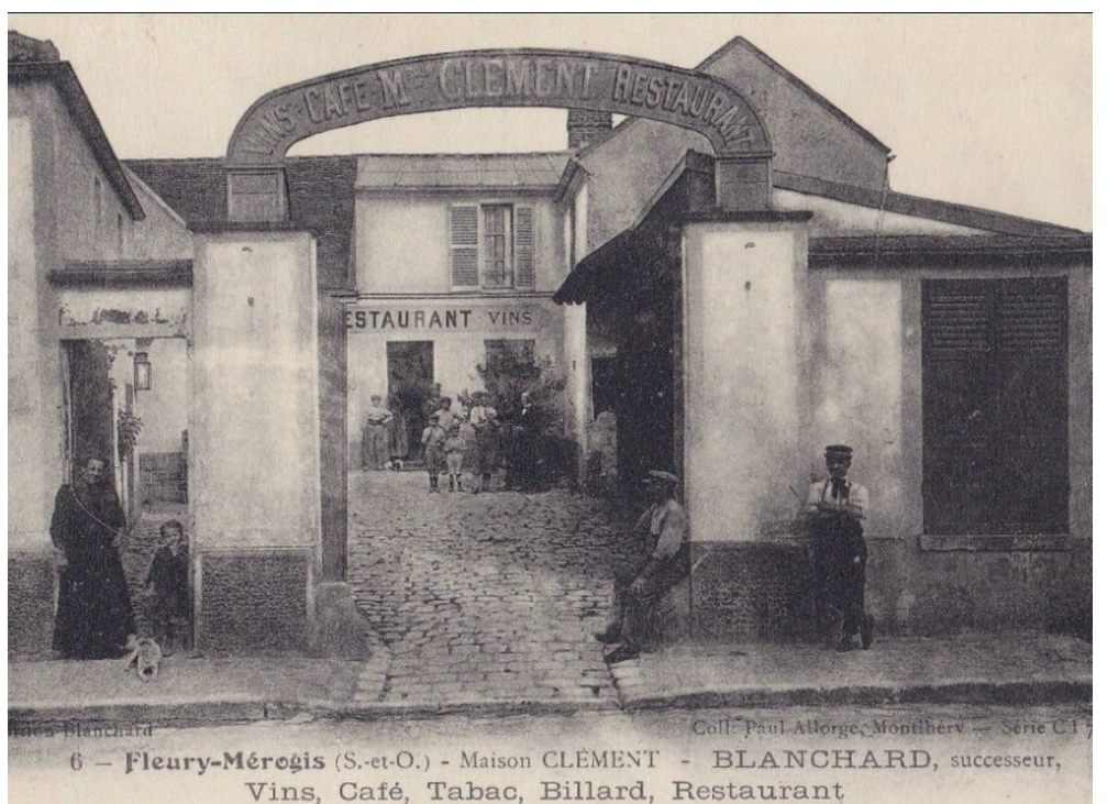
6 - Fleury-Mérogis (S.-et-O.) - Maison CLÉMENT - BLANCHARD, successeur, Vins, Café, Tabac, Billard, Restaurant

offrir à tous un voyage vers le passé pour mieux comprendre le présent. Toutes ces images donneront lieu ensuite à une restitution qui permettra à tous les habitants de découvrir ou redécouvrir leur ville en voyant l'évolution des lieux connus et d'autres moins connus. Alors n'hésitez pas à y participer. Vous pouvez venir déposer vos documents auprès du CVL au 11 rue Roger-Clavier ou par mail à cvl@mairie-fleury-merogis.fr - Infos et renseignements au 01 69 46 72 09. ■