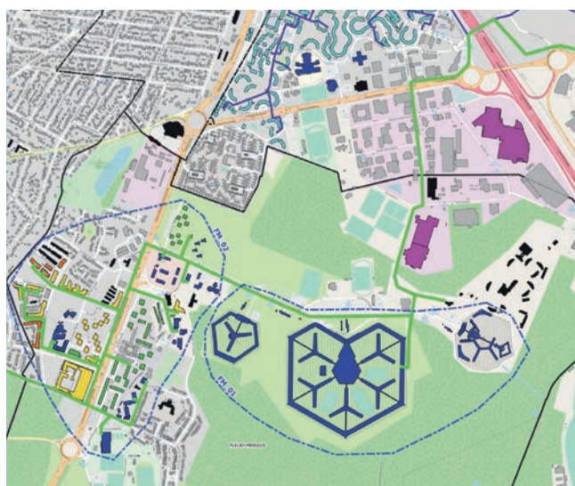
En vert, sur la carte, le tracé des nouvelles canalisations nécessaires pour raccorder le réseau de géothermie.

Les travaux devraient commencer au cours du second semestre 2022 et s'échelonnent jusqu'en 2025 au rythme de l'achèvement des contrats de fourniture gaz en cours. Ils consisteront en la création par étape, d'un nouveau réseau de canalisations (les spécialistes disent «feeder») d'une longueur de 5 kilomètres. Pour permettre ce