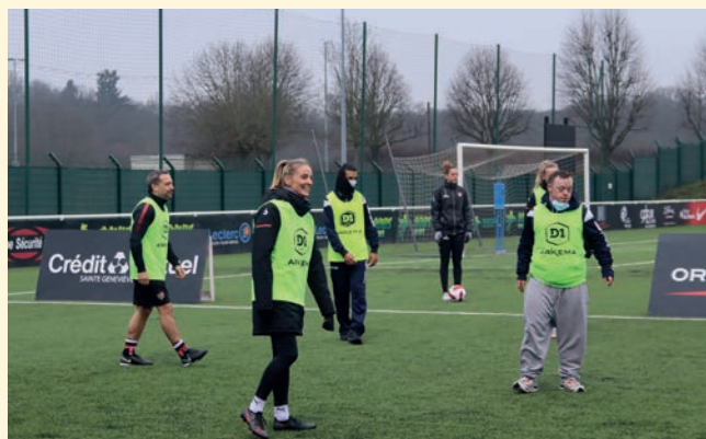
Tout au long de l'après-midi, des équipes mixtes ont joué les unes contre les autres.

Le temps d'une journée, l'équipe handisport accompagnée de plusieurs personnalités et des joueuses de D1 ont participé à un tournoi amical.