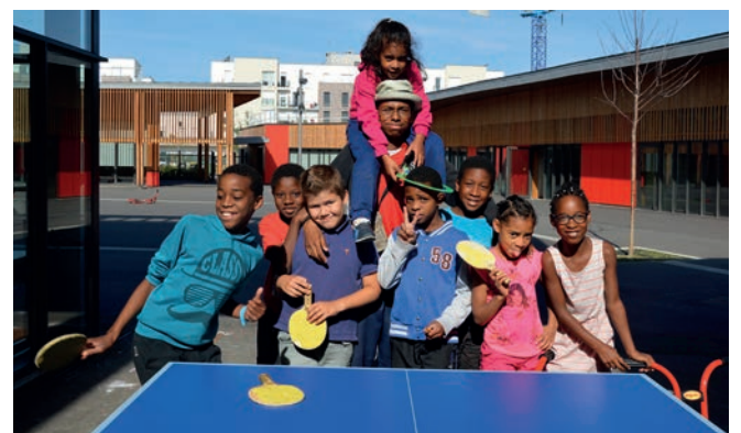
Les futurs animateurs ont réalisé leur stage pratique au centre de loisirs de l'école Robert-Desnos.

La dernière ligne droite avant d'obtenir le précieux sésame. Les candidats vont pouvoir analyser leur stage pratique afin d'approfondir et consolider ce qu'ils ont appris et notamment s'assurer qu'ils sont bien au fait des aspects réglementaires. C'est également le