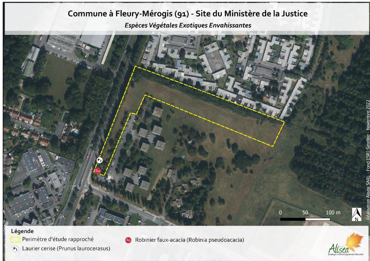
Figure 5 - Espèces végétales exotiques envahissantes recensées sur le site (Alisea 2022)