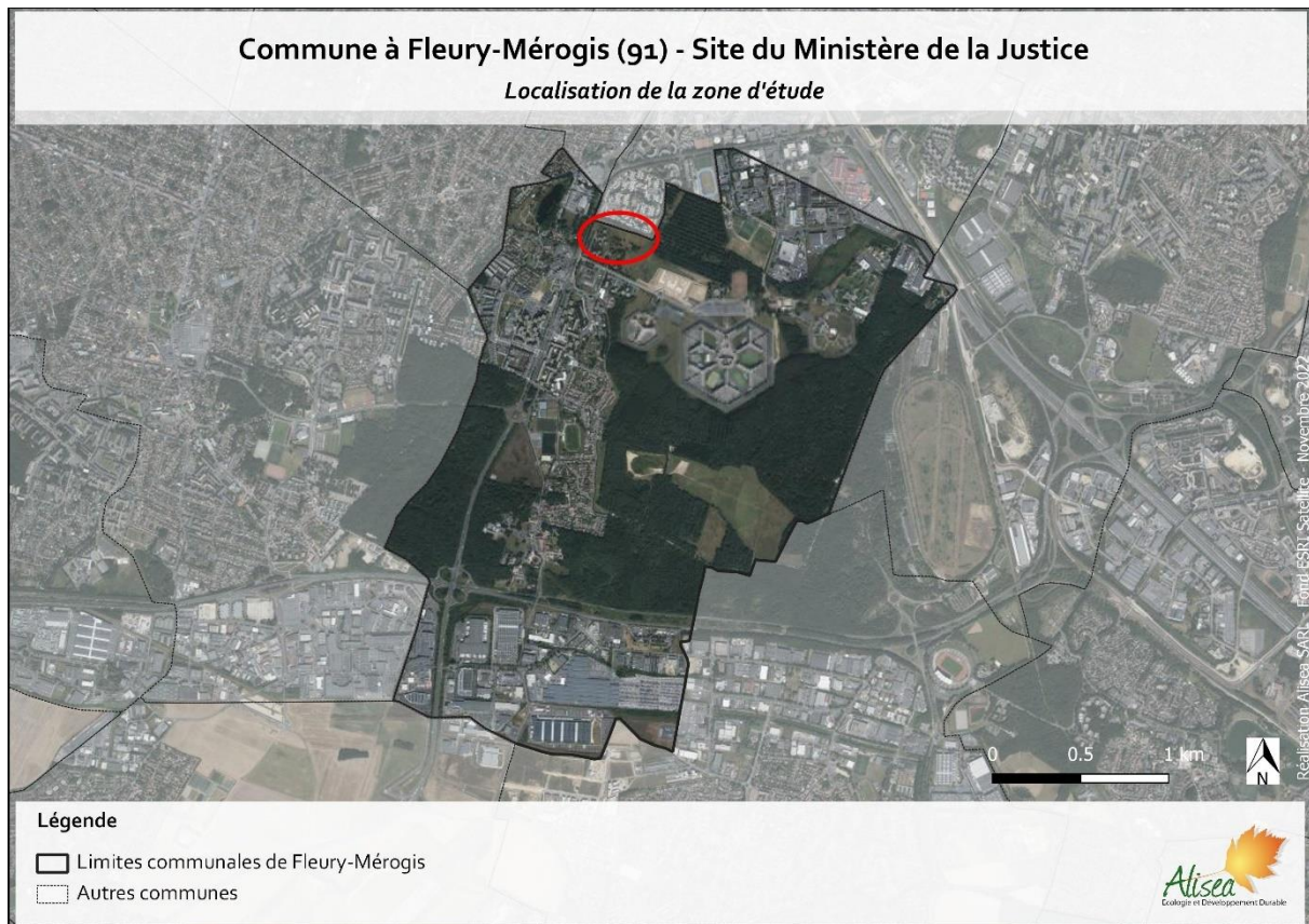
Figure 1 – Localisation de la zone d'étude (Alisea 2022)

Un repérage écologique a été effectué sur cette parcelle afin d'en évaluer les premiers enjeux en terme de préservation de la biodiversité.