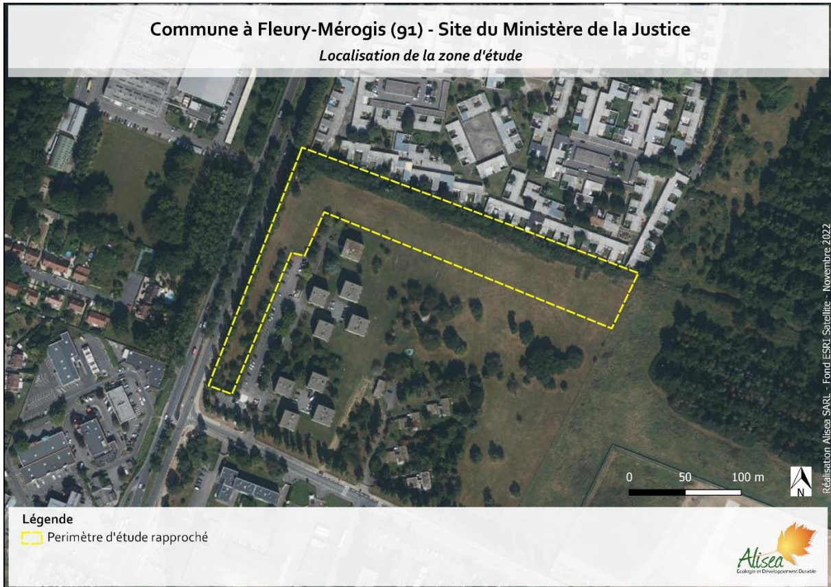
Figure 2 – Périmètre d'étude rapproché (Alisea 2022)

Le périmètre d'étude rapproché intègre le secteur envisagé pour l'emplacement des nouveaux jardins familiaux, mais aussi les abords immédiats et les accès.