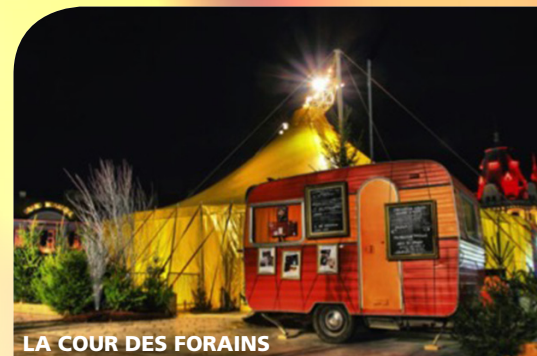
LA COUR DES FORAINS

ENTRÉE LIBRE | RESTAURATION SUR PLACE POSSIBLE PROPOSÉE PAR LES ASSOCIATIONS.