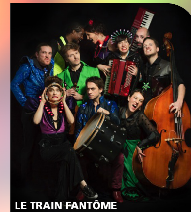
LE TRAIN FANTÔME